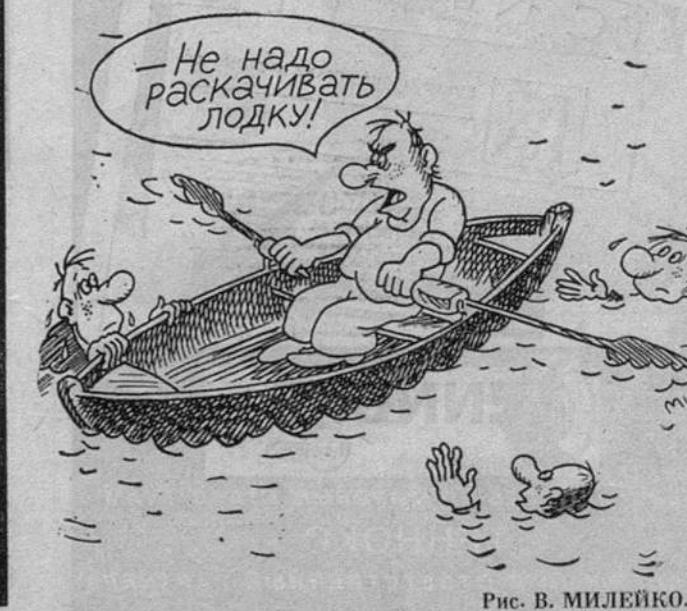
Рис. В. МИЛЕЙКО.