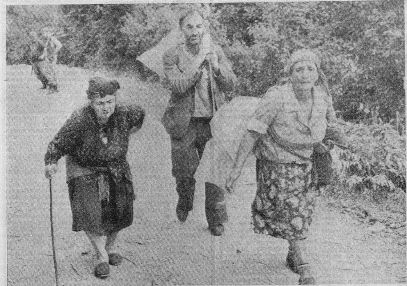
Один из пунктов подписанного соглашения о прекращении огня в Абхазии предусматривает, что будут приняты меры для возвращения беженцев в места их постоянного проживания, оказания им помощи. Этими проблемами занимается создаваемая специальная группа. От эффективности ее работы будет зависеть, когда тысячи мирных жителей, бежавших от войны, как эта грузинская семья, покинувшая Сухуми незадолго до подписа-

ния соглашения о прекращении огня, начнут возвращаться в родные места.