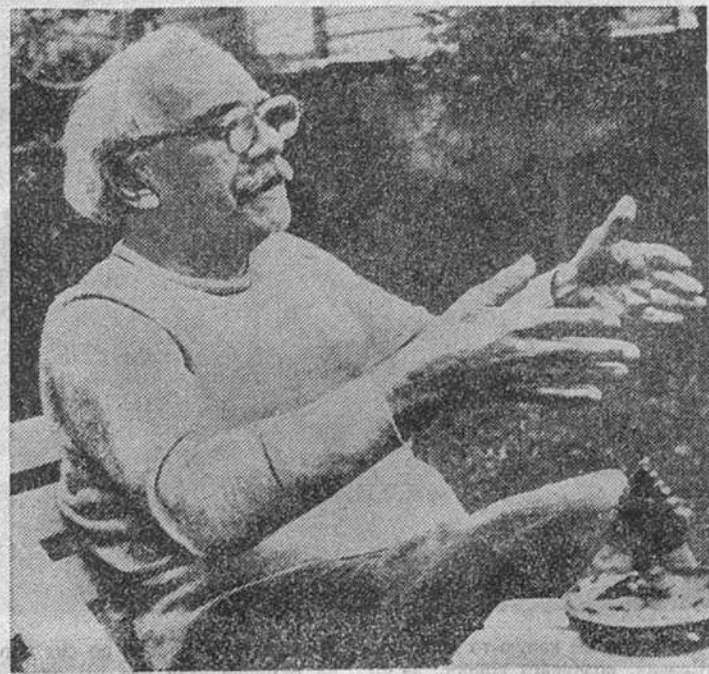
Сидит Самойлов в кресле. И говорит: «А есть ли?»

Давид Самойлов был из немногих поэтов, у которых поэзия как бы нечего и прибавить. Он жил не на виду, не обрета легенды. И у памяти Майковского не выступал, и в борисских делегациях за рубеж не ездил. И государственными премиями не подвергался, и в Доме творчества получил место лишь один раз в жизни. Он не занимал очередь за чем бы то ни было. Просто писал стихи. Хотя к средствам публикации долгие годы допущен не был. Не обижался на власть. В общем, как еще давно сказал о нем Борис Слуцкий, был «широко известен в узких кругах». И там, «в узких», его бо-