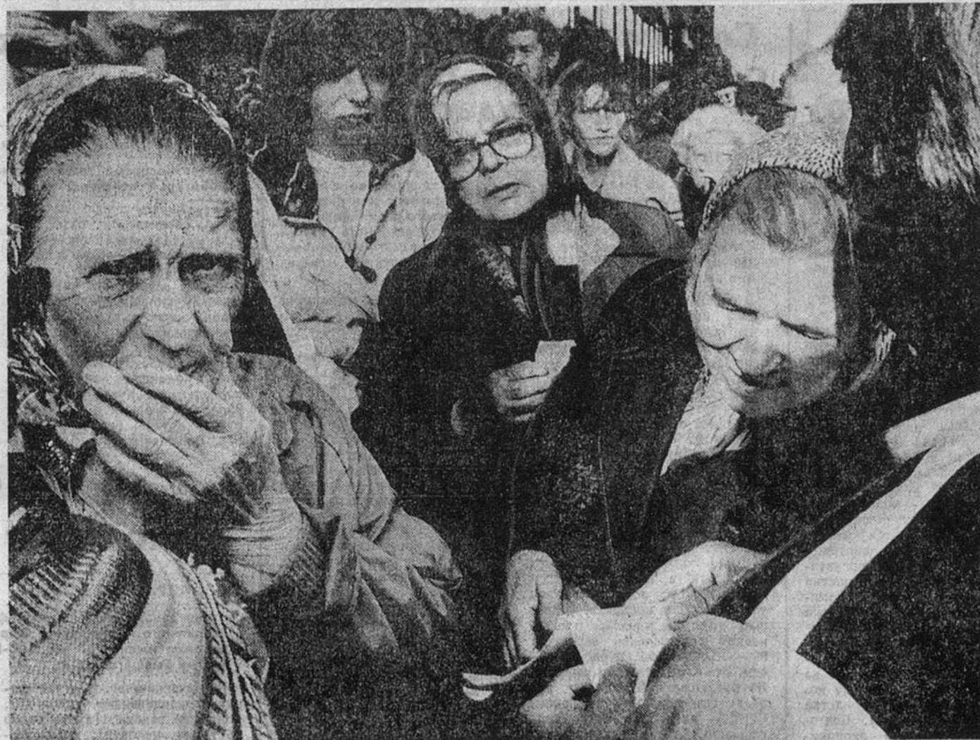
Москва, 26 июля, 13 часов. Очереди на обмен денег.