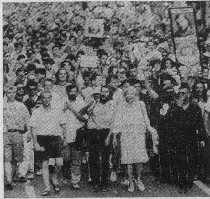
Манифестация в поддержку Вука Драшковица в Белграде.

В чем же обвиняют Драшковица? 4 июня в Белграде произошли события, отголоски которых не утихли до сих пор. В знак протеста против физической расправы в здании парламента над одним из депутатов оппозиции перед Скупщиной прошла манифестация, вылившаяся в массовые беспорядки. Несколько манифестантов и стражей порядка получили серьезные ранения, а один милиционер погиб.