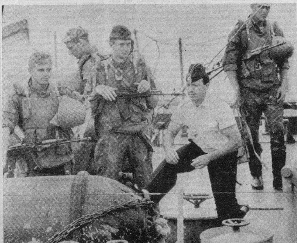
Бесик УРИГАШВИЛИ, «Известия»

Во время одного из таких экспериментальных полетов, где опробовался специальный режим, сразу после отрыва машины от полосы и произошла катастрофа. Пострадавшие члены экипажа немедленно доставлены в больницу. Ведется расследование причин катастрофы.