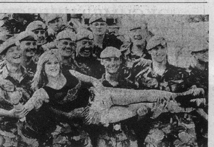
Британская певичка Саманта Фокс прибыла на один день в Боснию, чтобы поддержать боевой дух у солдат Юришиского полка, входящего в состав миротворческих сил ООН.

В Риме состоялись похороны трех итальянских солдат, погибших в Сомали в ходе выполнения миротворческой миссии ООН.