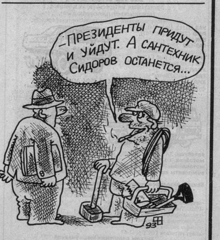
Рис. В. ФЕДОРОВА.