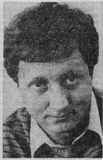
Валерий ВЫХОВТОВ, «Известия»

...российский парламент «упорядочит» деятельность печати, телевидения и радио, — за свободу слова будут давать от пятнадцати суток до пяти лет.