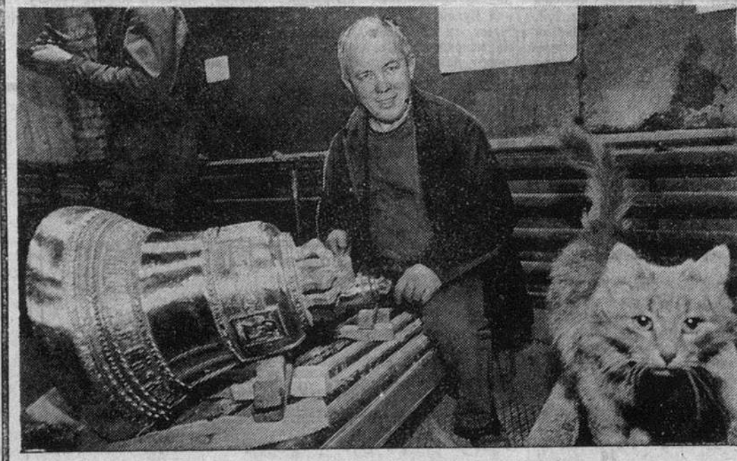
В акционерном обществе «Экспостроймаш» (Москва), основной продукцией которого является вибропрессующее оборудование для изготовления стеновых и дорожных плит, возродили — по инициативе старинной технологии — колокола. Сейчас рабочие участка художественного литья выполняют заказ Московской патриархии. На очереди — отли-