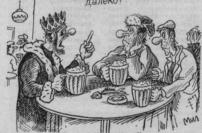
Рис. В. МИЛЕЙКО.

Нет мужики, — до истинной демократии нам еще далеко!