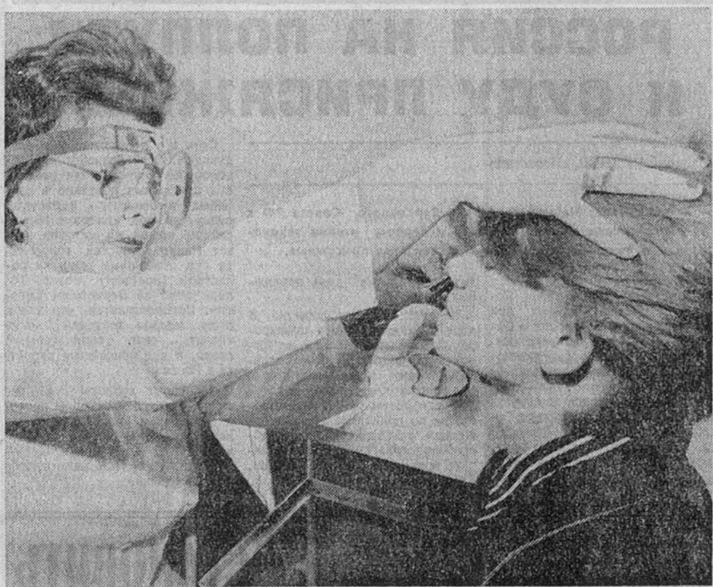
Виктор ЛИТОВКИН, «Известия»

На снимке, переданном нам для публикации агентством Рейтер, вы видите призывника, проходящего медицинскую комиссию перед отправкой в войска. Фотография актуальна. Именно в эти дни российский армия увольняет выслуживших свои сроки, а их место занимает пополнение.