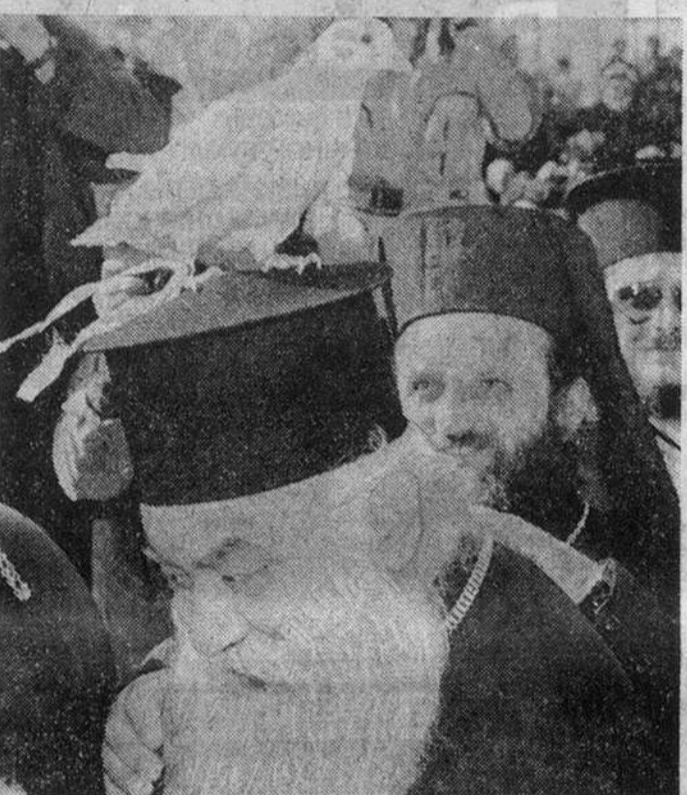
Белый голубь опустился на головной убор православного священника во время церковной службы на берегу реки Иордан, где согласно писанию Христос принял крещение от Иоанна Крестителя.

Хонеккер, с которого на прошлой неделе были сняты все обвинения, в настоящее время находится в Чили. Адвокат считает, что бывший лидер ГДР является единственным свидетелем, который может подтвердить, что это именно Варшавский пакт заставил руководство ГДР построить в 1961 году Берлинскую стену и несет всю ответственность за трагические последствия этого.