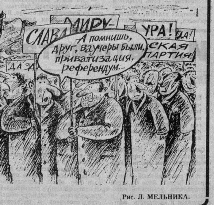
Рис. Л. МЕЛЬНИКА.

В Красноярск-35 собралась экстренная совещание, на котором присутствовали директор «Красмаша», большая группа