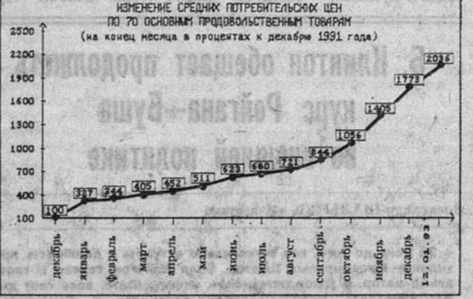
ИЗМЕНЕНИЕ СРЕДНИХ ПОТРЕБИТЕЛЬСКИХ ЦЕН ПО 70 ОСНОВНЫМ ПРОДОВОЛЬСТВЕННЫМ ТОВАРАМ (на конец месяца в процентах к декабрю 1991 года)

На прошедшей неделе практически не отмечалось роста