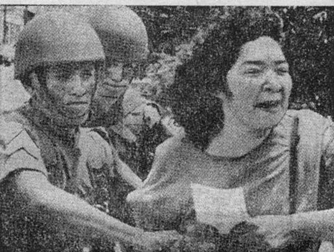
Полицейские разгоняют демонстрацию протеста против акций президента возле здания Верховного суда в столице Гватемалы.