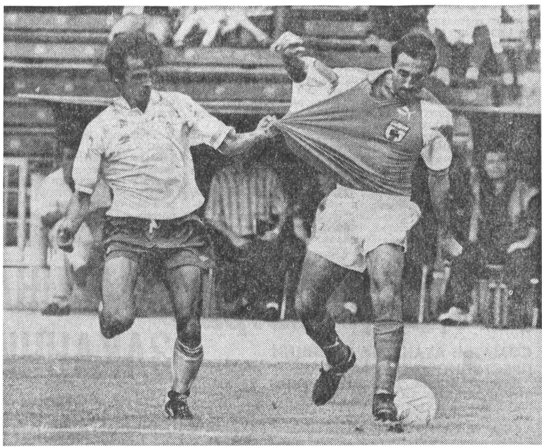
Ты меня уважаешь!