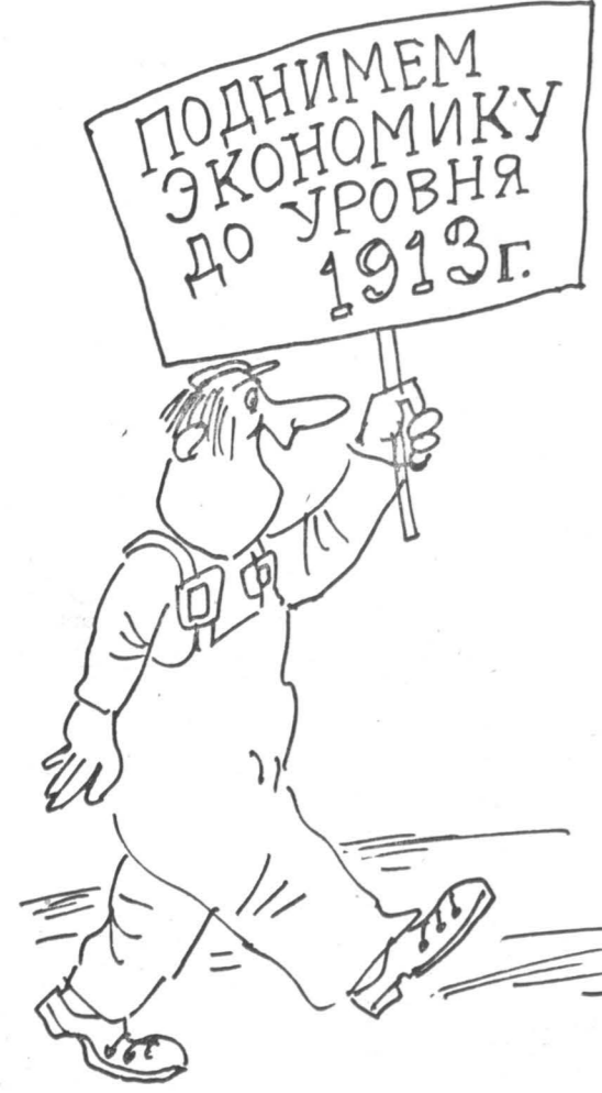
Рис. Евгения ВАСИЛЬЕВА.