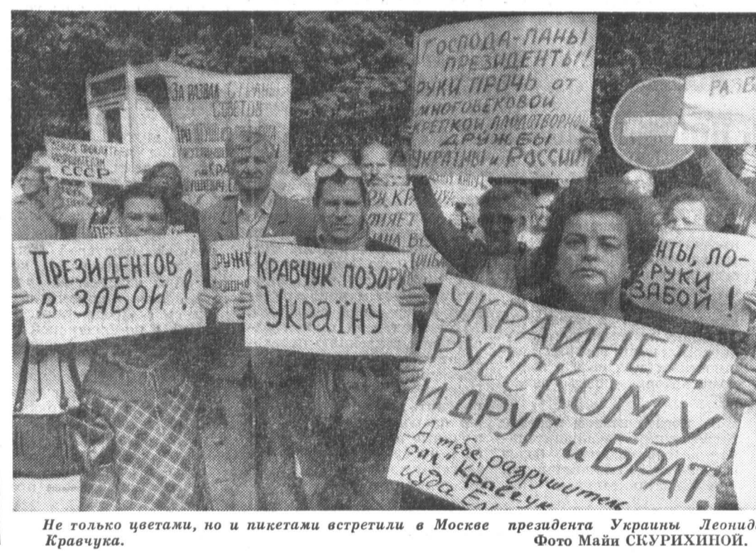
Не только цветами, но и лозунгами встретили в Москве президента Украины Леонида Кравчука.