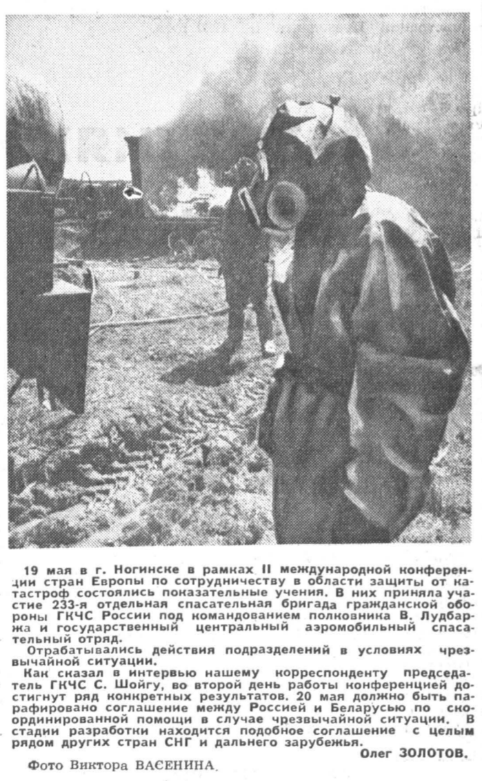
19 мая в г. Ногинске в рамках II международной конференции стран Европы по сотрудничеству в области защиты от катастроф состоялась познательная встреча. В ней приняла участие 233-я отдельная спасательная бригада гражданской обороны МЧС России под командованием полковника В. Лудбарна и государственный центральный авиационный спасательный отряд. Обработавшись действия подразделений в условиях чрезвычайной ситуации. Как сказал в интервью нашему корреспонденту председатель ГИЧС С. Шойгу, во второй день работы конференции достигнут ряд конкретных результатов. 20 мая должно быть парализовано соглашение между Россией и Беларусью по скоординированной помощи в случае чрезвычайной ситуации. В стадии разработки находится подобное соглашение с целым рядом других стран СНГ и дальнего зарубежья. Олег ЗОЛотов.