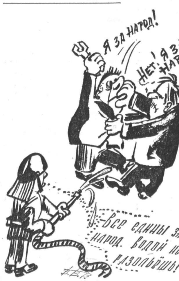
Рис. Виктора ВОЕВОДИНА (г. Москва).