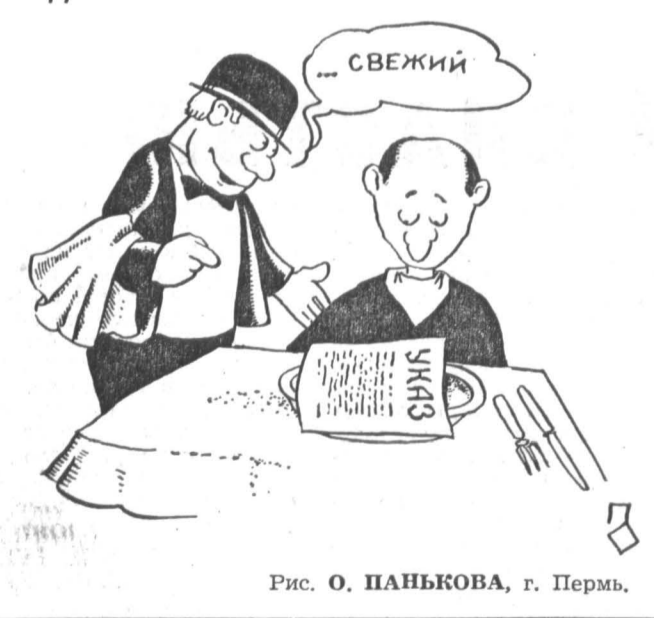
Рис. О. ПАНЬКОВА, г. Пермь.