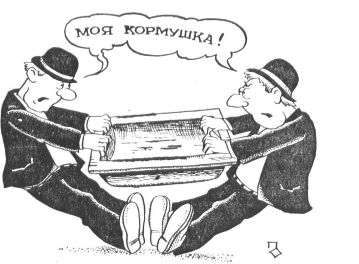
Рис. Олега ПАНЬКОВА.

У каждого маленького уголка страны во время референдума были свои маленькие тайны. Вот и в Краснопресненском районе столицы был свой вопрос — в пятом бюллетене.