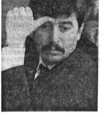
Выйти с проектом новой Конституции. (ИТАР—ТАСС).

В сообщении прес-службы Президента Российской Федерации от 23 марта 1993 года было обращено внимание на то, что в официально выпущенном тексте Закона Российской Федерации «Об изменениях и дополнениях Конституции (Основного Закона) Российской Федерации — России», принятого седьмым Съездом, содержится сноска к статье 54 данного Закона о том, что побуждающие статьи 121 Конституции Российской Федерации в части немедленного прекращения полномочий Президента Российской Федерации не вступают в действие до проведения референдума по основным положениям проекта новой Конституции (Основного Закона) Российской Федерации.