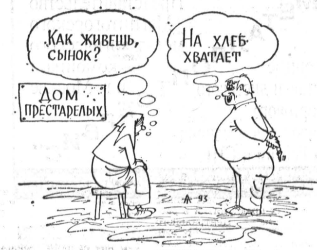
Рис. Алексея ТАЛИМОНОВА.