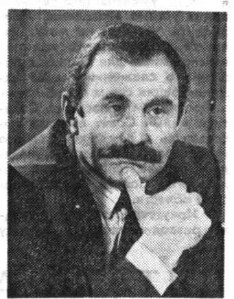
— Прежде всего подчеркнем, — сказал Асланбек Ахмедович, — что и члены нашего комитета полностью разделяем обеспокоенность граждан России размахом коррупции, которая захлестывает страну. Вряд ли будет преувеличением сказать, что коррупция если не душит, то уже держит нас за горло.

В народе бытует мнение, что сейчас в стране не берет взятку только легионеры или тот, кому ничто не дает, поскольку в этом просто нет необходимости. Особую тревогу вызывает коррупция, которой поражены все слои власти разного уровня. Вот почему подготовленный Комитетом по вопросам законодательства и борьбы с преступностью Верховного Совета Российской Федерации проект закона «О борьбе с коррупцией» вызывает повышенное общественное внимание. Об этом законопроект читателям «Российской газеты» рассказывает председатель комитета Асланбек АСЛАХАНОВ.