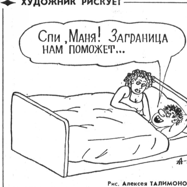
Рис. Алексея ТАЛИМОНОВА.

К сожалению, в истории Государства Российского всегда было больше печальных страниц, нежели светлых. Может быть именно поэтому русскому характеру свойственны великодушие, терпимость. Но и другое следует помнить: сегодня из истории: наш великий народ никому не прощад своих унижений и обид.