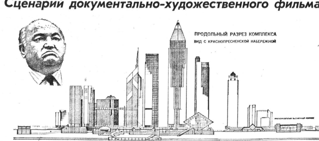
Коллаж А. БОМЗЫ и Н. КАСИМЦЕВОЙ.

Сценарий документально-художественного фильма