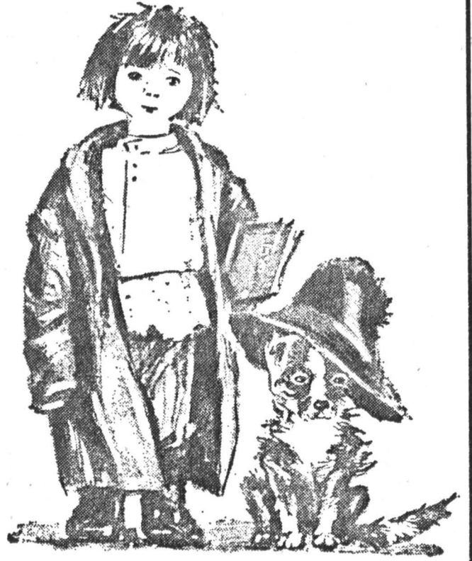
Рис. Е. МАРШАКОВОЙ.