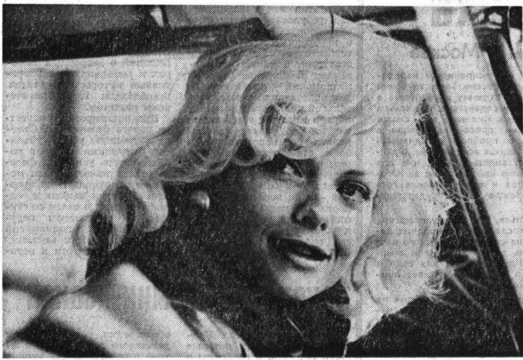
На снимке: Мишель Пфаффер в фильме «Поле любви».

фильме «Цементный сад» (Серебряный Берлинский Медведь) остается художником произведений которого можно без преувеличения поставить в один ряд с «Тунами» звездами Большой Медведицы Виконта.