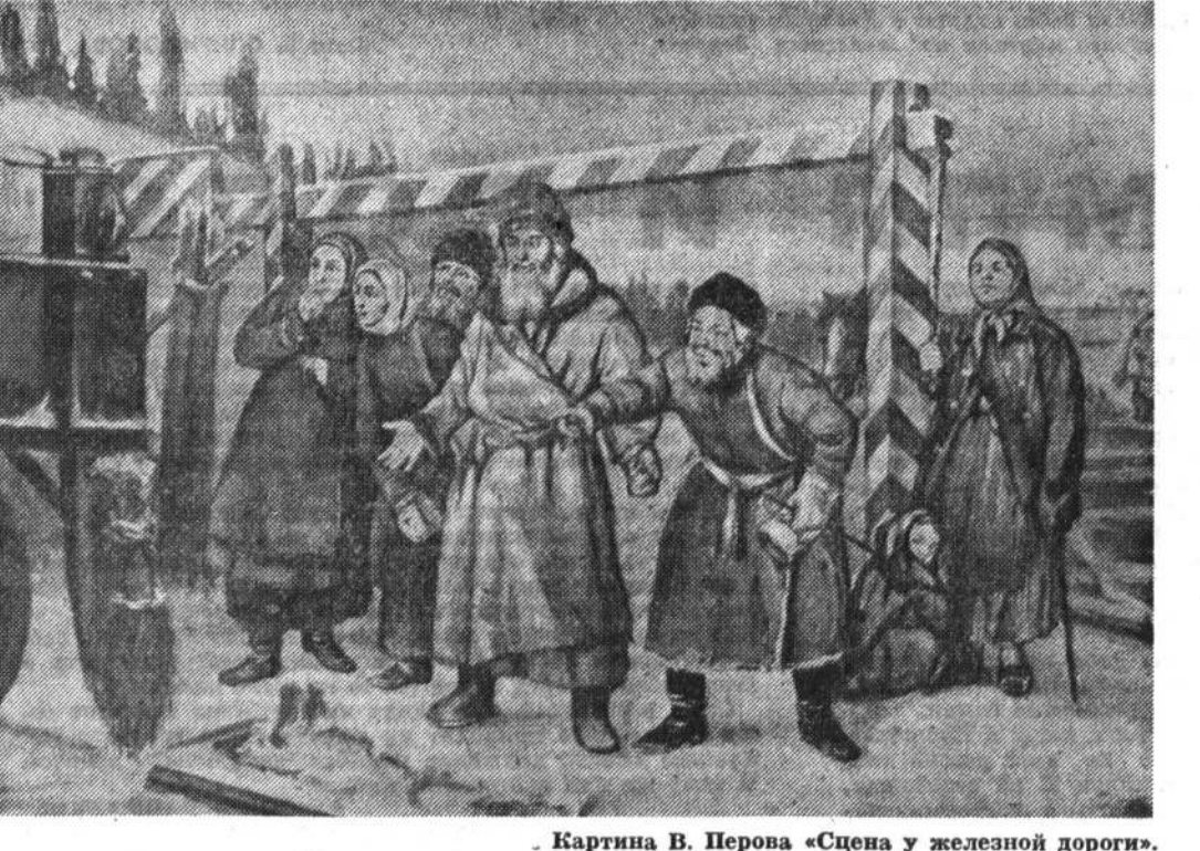
Картина В. Перова «Сцена у железной дороги».

Дворовые крестьяне Тамбовской губернии, по свидетельству историков, воспри-