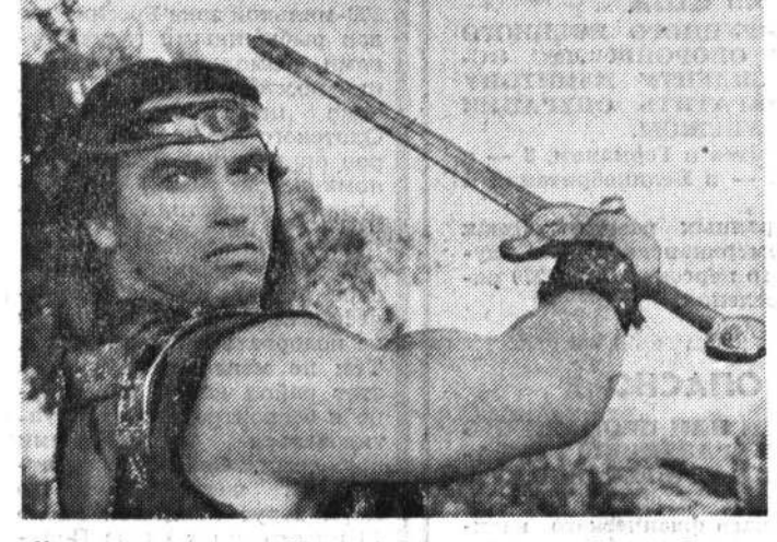
На снимке: Арнольд Шварценеггер в фильме «Рыбак Соня».

Голливуд — слово звучало музыкально для двадцатилетнего ладно скроенного паренька из австрийского городка Грац.