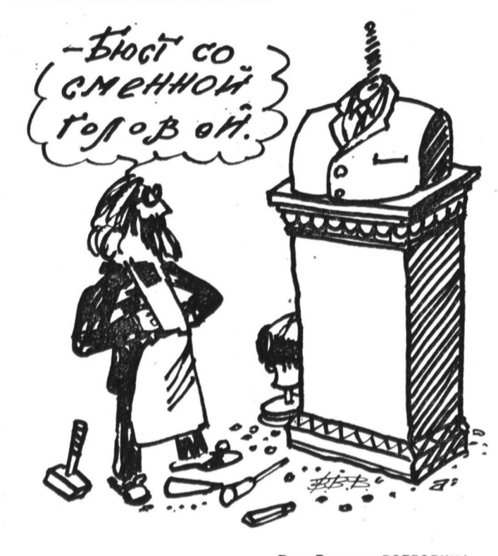
Рис. Винтора ВОЕВОДИНА.

павшие отмечали, что во многих случаях движение шло в кильватере политики Президента России, отнюдь не заботясь о своей собственной позиции по многим принципиальным вопросам, например по поводу международных конфликтов. Все это привело к тому, что сегодня, как заметил старопольский делегат, даже неизвестно кого и чего поддерживать. Превратился ли мы в крепкую организацию или так и останемся вечной подкачкой у кого-то из сильных мира сего? — заключил свою речь представитель демократического юга России.