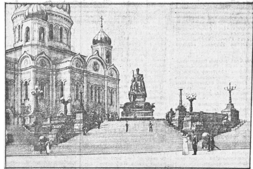
Эта фотография взята нами из фотокниги «Храм Христа Спасителя в Москве», презентация которой состоялась вчера.