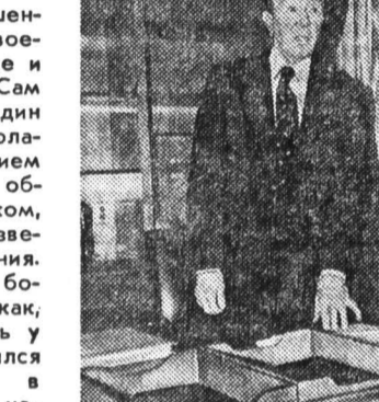
не тот человек, который идет на сделки и манипулирует людьми. Он не говорит, он действует... Я бы доверил ему любую тайну.

«Он старается избежать первого плана, явно предпочитая второй. Так и кажется, что будто это про него было сказано в древности: трудится больше всех, но меньше других говорит о США».