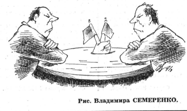
Рис. Владимира СЕМЕРЕНКО.