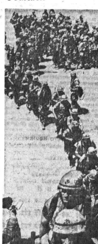
Американский военный контингент из Сомали уходит, его сменил силы ООН — а проблеме, мы страны так же далеки от решения (см. сообщения в рубрике «Вчера, сегодня, завтра»).