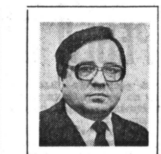
Владимир БЕРЕЗОВСКИЙ, собственный корреспондент

— С просьбой усиления миротворческого участия в прекращении войны я намерен обратиться в Ватикан и в Православную Церковь, — отметил шейх на встрече с журналистами. — Они способны оказать влияние на политиков и на события.