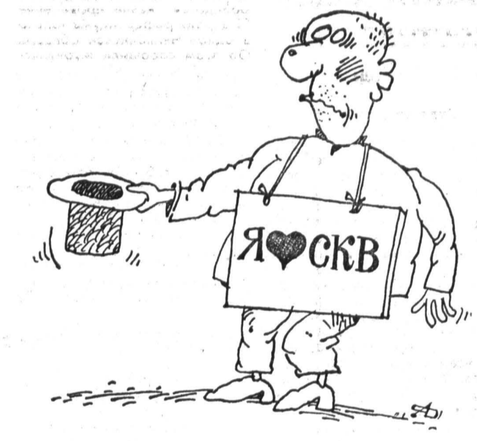
Рис. Александра ДЬЯКОНОВА.

(Окончание. Начало на 1-й стр.) целесообразно дать возможность акционерам реализовывать свои ваучеры на акции предприятия по номинальной стоимости.