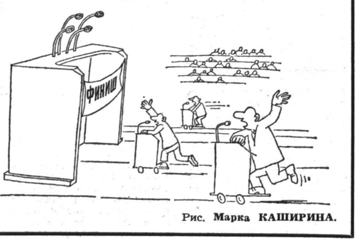
Рис. Марка КАШИРИНА.