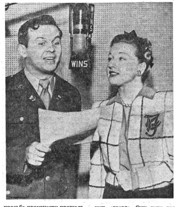
Джонни Грант и женщина.