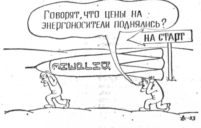
Рис. Алексея ТАЛИМОНОВА.

(По материалам «Интерфакс», РИА «Новости»).