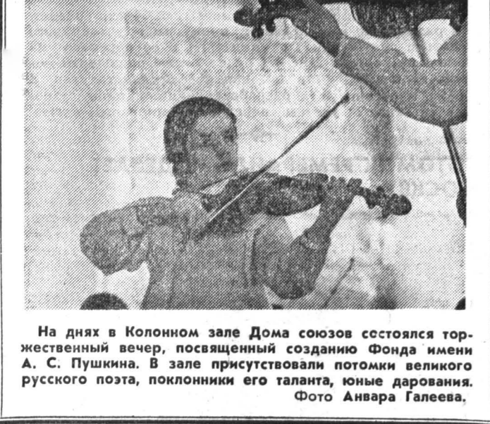
На днях в Колонном зале Дома союзов состоялся торжественный вечер, посвященный созданию Фонда имени А. С. Пушкина.

В БЛИЖАЙШЕЕ ВРЕМЯ ПЕРМСКОЕ ГЛАВНОЕ УПРАВЛЕНИЕ ЦЕНТРАЛЬНОГО БАНКА РОССИИ ПРИСТУПИТ К ВЫПУСКУ В ОВРАЩЕНИЕ НА ТЕРРИТОРИИ ОБЛАСТИ РОССИЙСКИХ ДЕНЕЖНЫХ КУПОН ОБРАЗА 1993 Г.