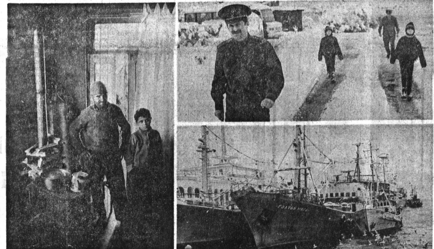
Репортаж нашего специального корреспондента, только что вернувшегося из Аджарии, читайте на 7-й странице.