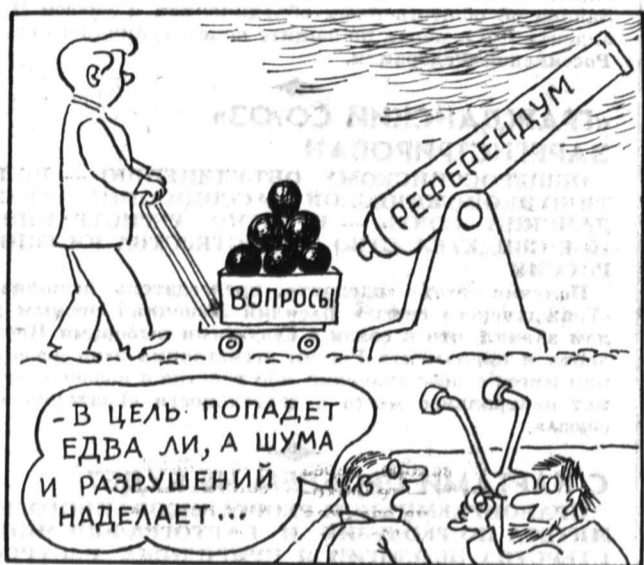
Рис. Марка КАШИРИНА.