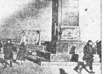
горельеф «На границе», его переведенная в металл копия хранится в Волгоградском музее изобразительных искусств.