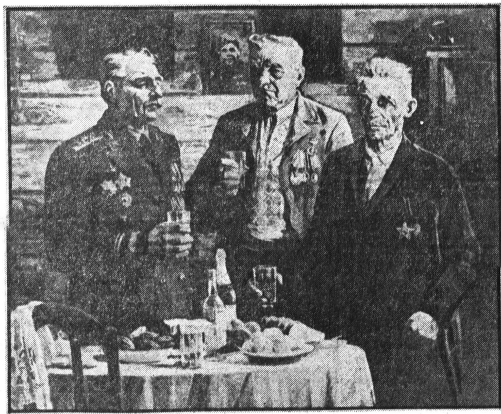
Подборку материалов о 50-летию Победы под Сталинградом читайте на 8-й странице.