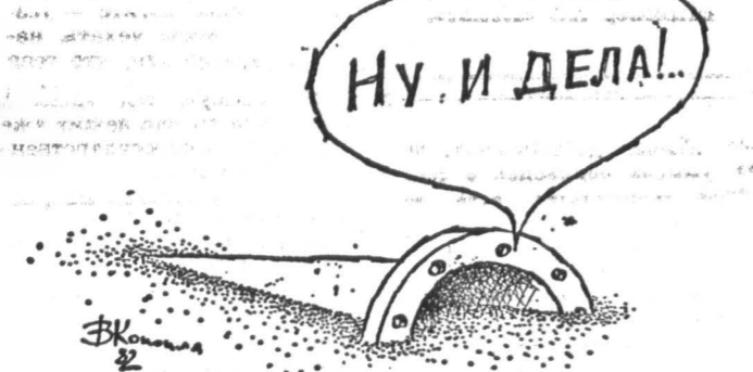
Рис. Вадима КОНОПЛЯНСКОГО.

Пресс-служба ГУВД Москвы и Отдел по связям с общественностью ГУ ЦБ по г. Москве.