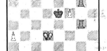
Задача № 7. Белые: Кр2, Л3, Ф5, пп. 2, 4 (5); черные: Кр4 (1).

Роман Альтштерлер, мастер спорта по шахматам