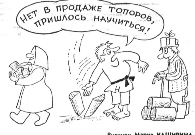
Рисунок Марка КАШИРИНА.