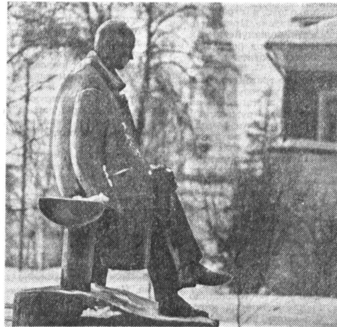
Памятник Н. Рубцову в городе Тотьма.