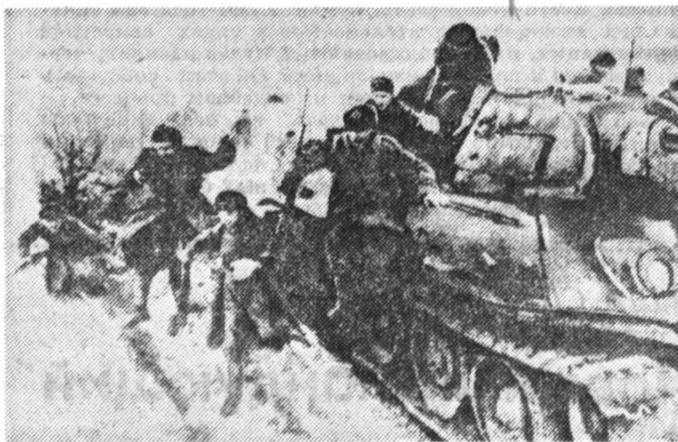
Блокада снята. Наступление продолжается.

Представление о том, что у могил принято скорбеть, а не бесноваться — вне морально-го колеска одумранной нации — коммунистической пропагандой публики.