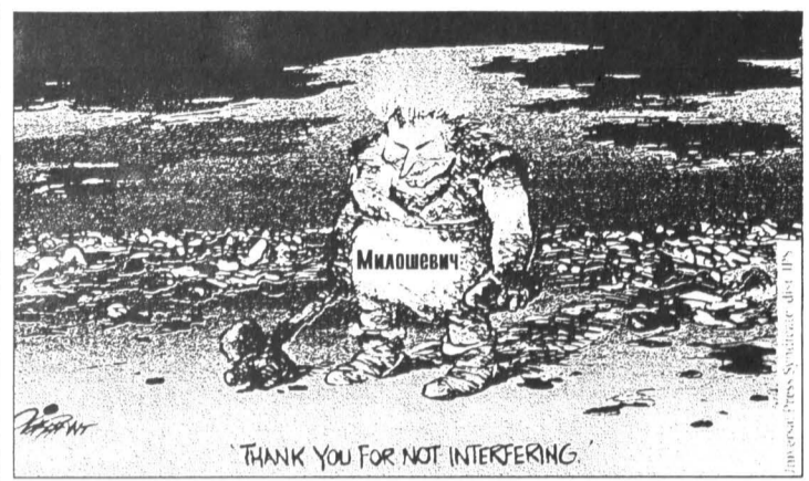
лишь ширма, скрывающая истинное положение вещей.

Анализ функций югославского президента узок, и реальная власть находится в республиках, в руках их президентов. Если бы совсем точно — в руках президента Сербии Слободана Милошевича. А в условиях мнимой многопартийности, декларированной после ухода Союза коммунистов Югославия, точнее, его трансформации в социалистическую партию, именно последний принадлежит монопольное право принимать решения на уровне республиканских парламентов и правительств. Вот почему федеральные органы и президент, по выражению одного из лидеров местной демократической оппозиции, — это