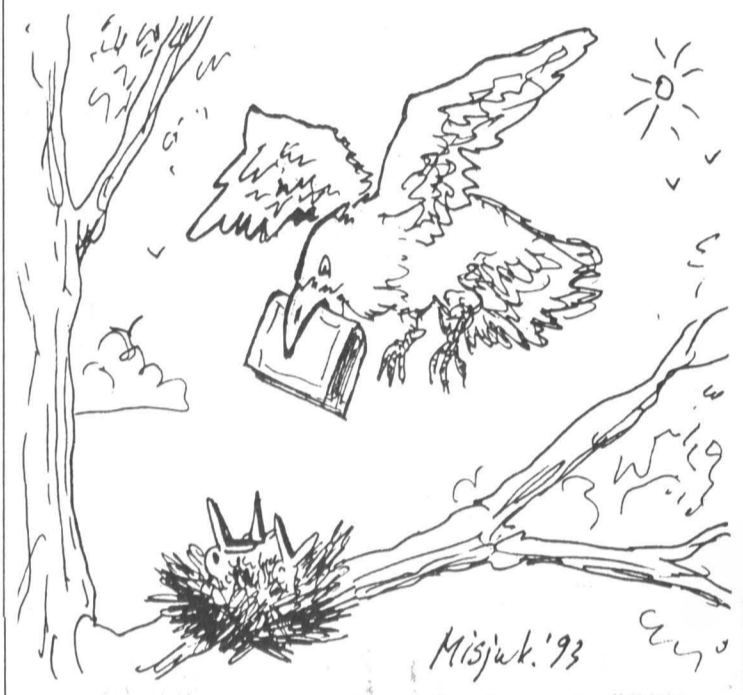
Рисунок Вадида Мисюка

Чтобы строго проводить эту принципиальную установку в жизнь, необходимо решить и другой вопрос — как сделать финансирование соответствующих расходов действительно гарантированным. Планирование бюджетных расходов основывается на прогнозных индексах цен, которые даже на ближайший квартал могут оказаться [опыт прошлого года показал, что, как правило, и оказывались] ниже, чем фактический рост цен. Возможный выход, на наш взгляд, в том, чтобы все дополнительные отнесенные к гарантированным