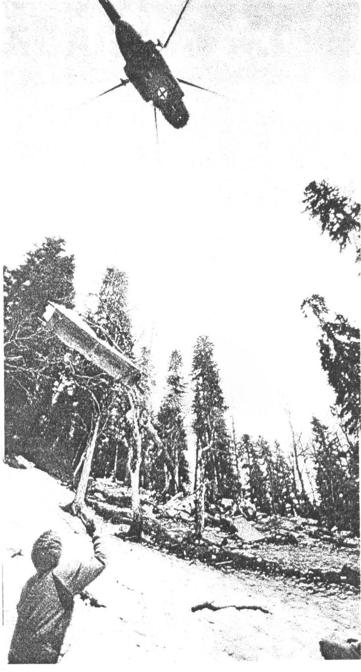
Фото № 3