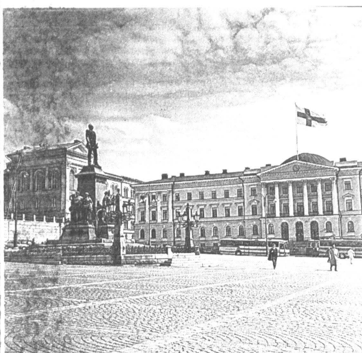
Памятник Александру II на Сенатской площади в Хельсинки

бище, что неподалеку от завода, есть семейная могила с установленным на ней обелиском и выгравированными на граните именами успешных славных российских предпринимателей. На Булеварди же находится старинное трехэтажное здание, построенное в 1870 году для театра офицерского собрания русской армии. С 1918