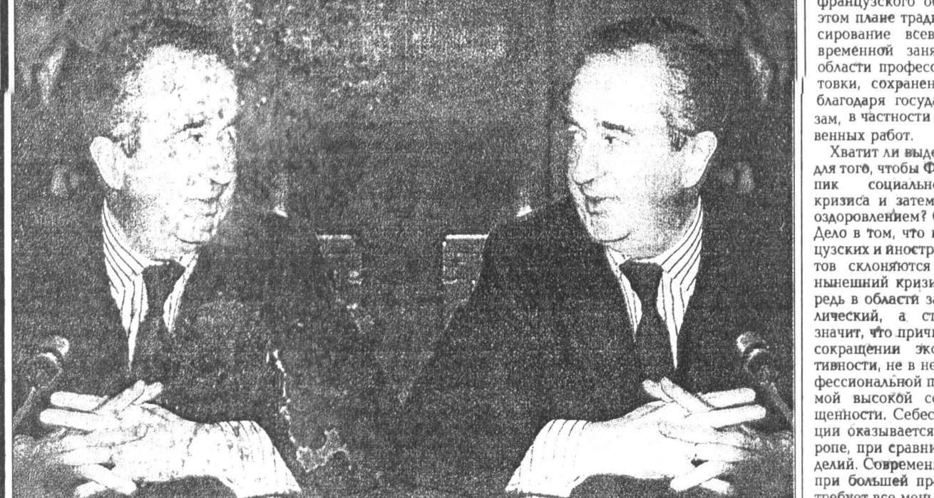
«Балладюр-один» и «Балладюр-два»