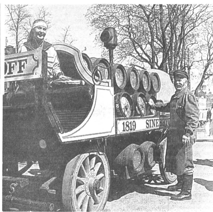
Повозка с пивом «Sinebrychoff» на улицах Хельсинки

В стране две официальные религии: лютеранская и православная, пришедшая сюда через Псков, Новгород, Карелию. Время внесло