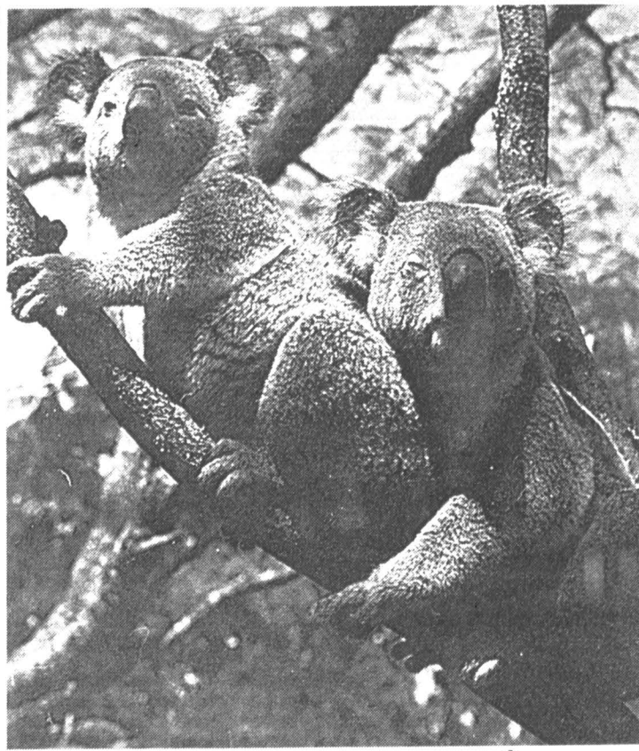
Обитатели «Коала парка»

Помимо мишек коала здесь содержатся и другие эндемичные для Австралии виды животных — траусы эму, дикие собаки динго (вместе с мирными и игривыми животными), волкосты, голосистые птицы кукабарра и говорящие лугуны какаду. Есть, конечно же, и различные виды кенгуру. Правда, в «Коала парк» живут лишь амки кенгуру, так как самцы от-