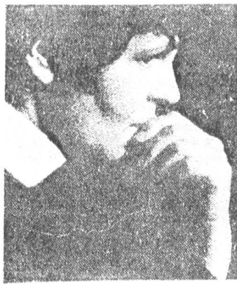
Галина Устьольская. Фото 1986г.

Трудно представить, как слушатели радиоканала «Орфей» (вместе с «Московскими новостями») он