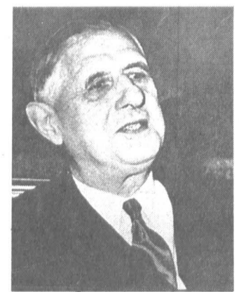
Генерал Шарль де Голль

В правовом плане де Голль и его правительство оказались если не в уникальной, то в специфической ситуации. Предоставив особые полномочия главе исполнительной власти, парламент делегировал ему учредительное право на выработку проекта новой конституции при соблюдении основных принципов демократии.