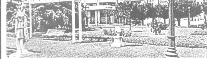
Площадь Испании в Буэнос-Айресе

Аргентинская таможня достаточно либеральна, но существующие правила нарушать все же не следует.