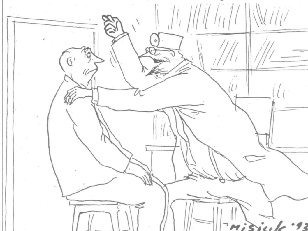
Рисунок Вагима Мисюк

Социальная психология превращается в социальную психиатрию