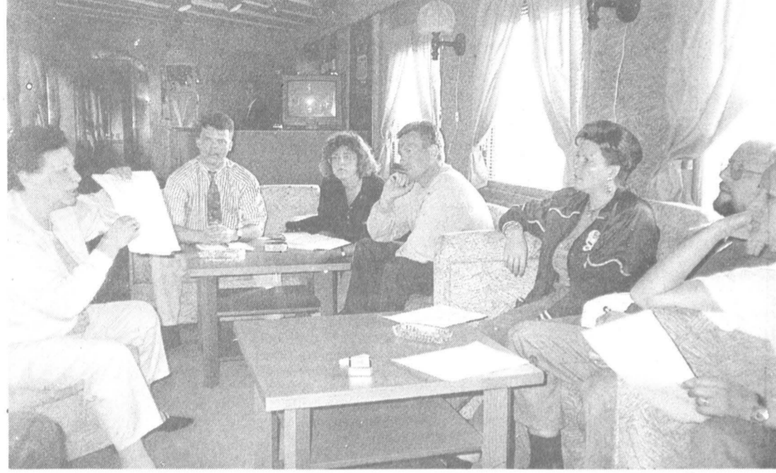
В специально оборудованных вагонах есть все условия для работы и отдыха

После переоборудования туристский поезд акционерного общества «Ритм-трейн» так теперь называется этот состав — «Ритм-трейн».