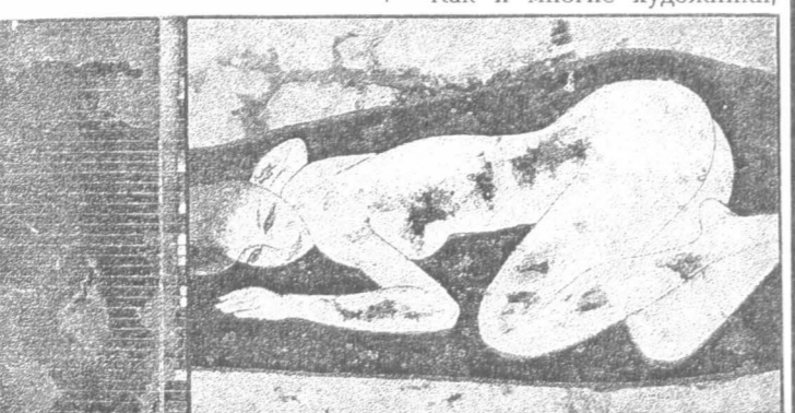
Ню. 1980 г.

рижской Академии де ля Гранд Шомьер и постигал тайны современного европейского искусства. «Честный практикант» реализма, он от рисунка с натуры шел к фигуративной живописи, затем к кубизму и, наконец, к абстракционизму.