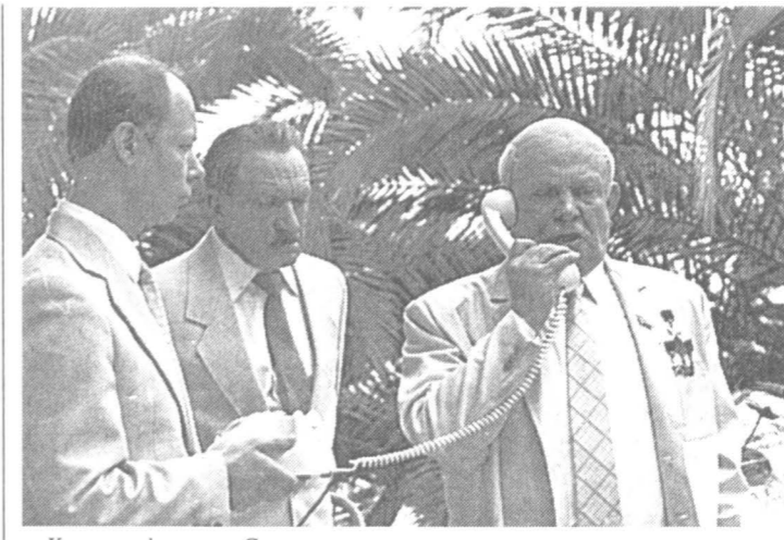
Кадр из фильма «Серые волки».

«Кодекс бесчестия» (сценарий В. Черныя и В. Шиловского, постановка В. Шиловского) сделан по канонам политического детектива, давно установившимся в советском кино.