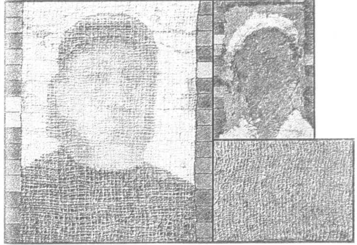
Автопортрет. 1980 — 1990 гг.

В МУЗЕЕ изобразительных искусств имени Пушкина открылась выставка картин корейского художника Кимсу (р.1919; наст. имя Ким Хын Су).