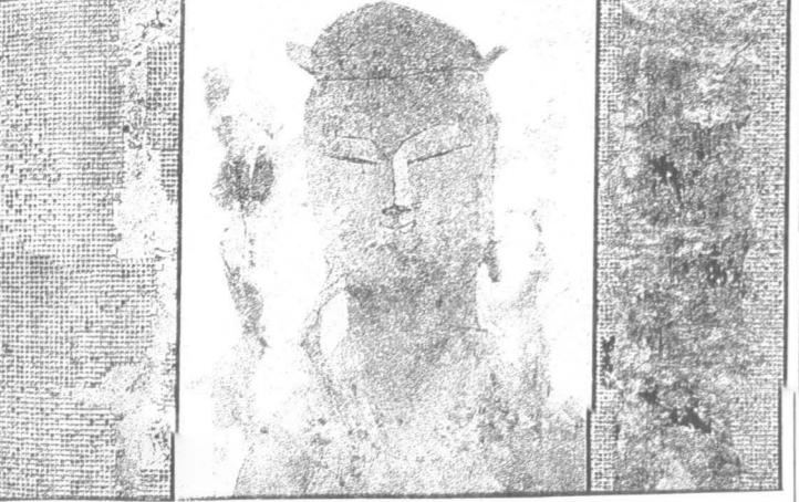
Озарение. 1977 г.

Все художники ищут гармонию, даже те, кто разрушает ее. Однако Кимсу — «гармония» принципиальный, осознающий гармонию как цель своего искусства.