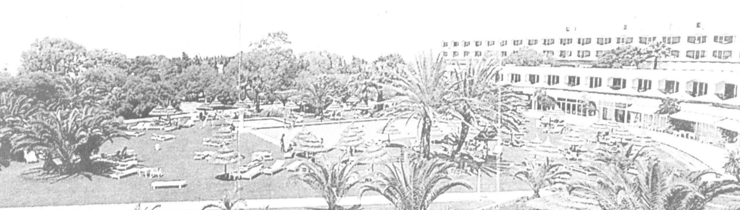
Один из отелей курорта Хаммамет

На африканском курорте наши бизнесмены строят отели