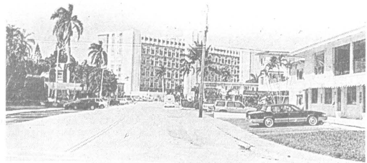
Форт-Лаудердейл. Мотель «Голден Сендз» (справа)

ВНЕБЕ над морем вертолет тащит за собой пеструю рекламную ленту. С городской улицы не разглядеть, что-то очень лаконично. А из прибрежных ресторанчиков пахнет чем-то вкусным — то ли рыбой, запеченной на углях, то ли цыплячьим филе, приготовленным специальным способом на решетке. Одним словом — море, солнце, пляж и полное отсутствие забот! Ну-ка, угадайте, где находится этот райский уголок, где мы с вами — обыкновенные российские граждане — можем сегодня провести отпуск? Бьюсь об заклад, проспорите! Море, солнце, пальмы можно найти на любом черноморском пляже. (Разве что бесплатная выпивка не на всякой дискотеке бывает). Этот райский уголок — на другом краю планеты, и, несмотря на это, — он наш с вами.