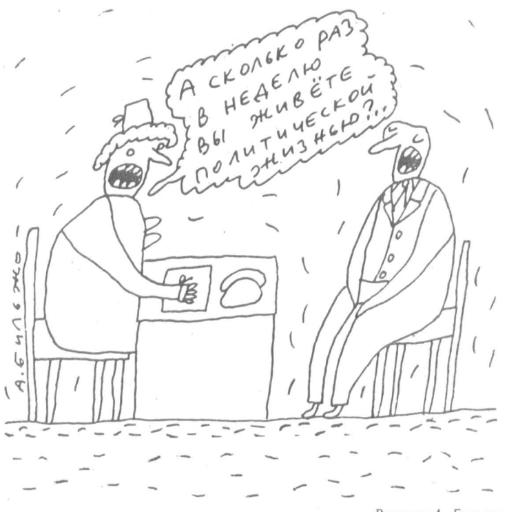
Рисунок А. Бильжо

Сам же творчество будет развиваться параллельно действительности, а не перпендикулярно к ней, когда ему приходилось в нее врезаться или удаляться в надзвездные миры. Тогда искусство не будет хромьким, преданно-аллегорическим; оно напомнит о Вечном, а не синонимично, никому, в принципе, не нужно.