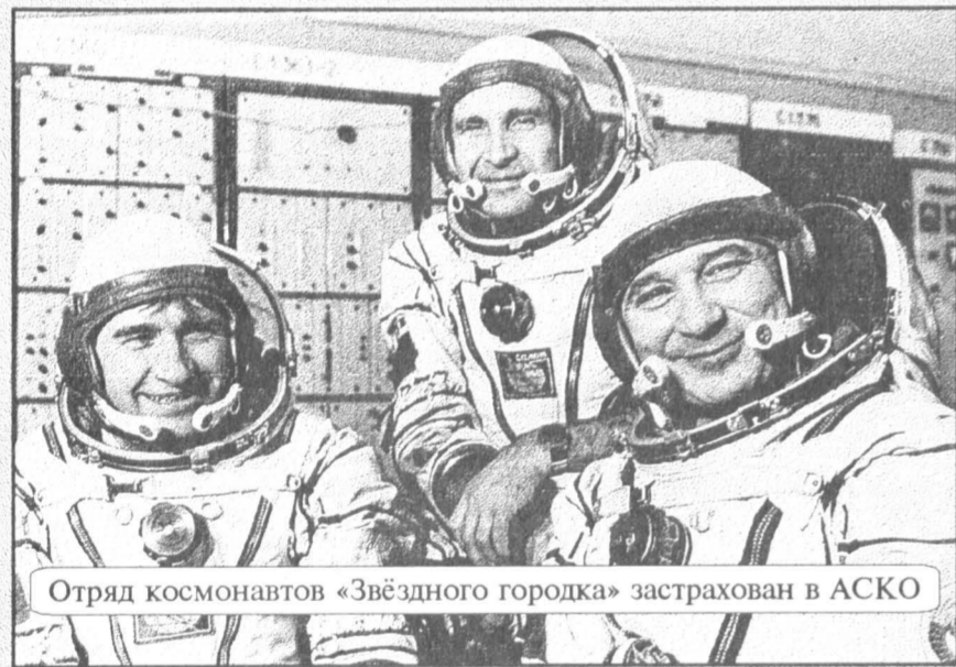
Отряд космонавтов «Звездного городка» застрахован в АСКО

Не исключено, что сегодняшнее бедственное положение на Памире лишь преддверие к новым бедам. В случае ввода правительственных войск в Горный Бадахшан и, несомненно, последующих вслед за этим кровавых столкновений таджикской армии с памирцами последует волна эмиграции памирцев в Афганистан, сравнимая по масштабам с бегством таджиков в это исламское государство в конце 1992 г.