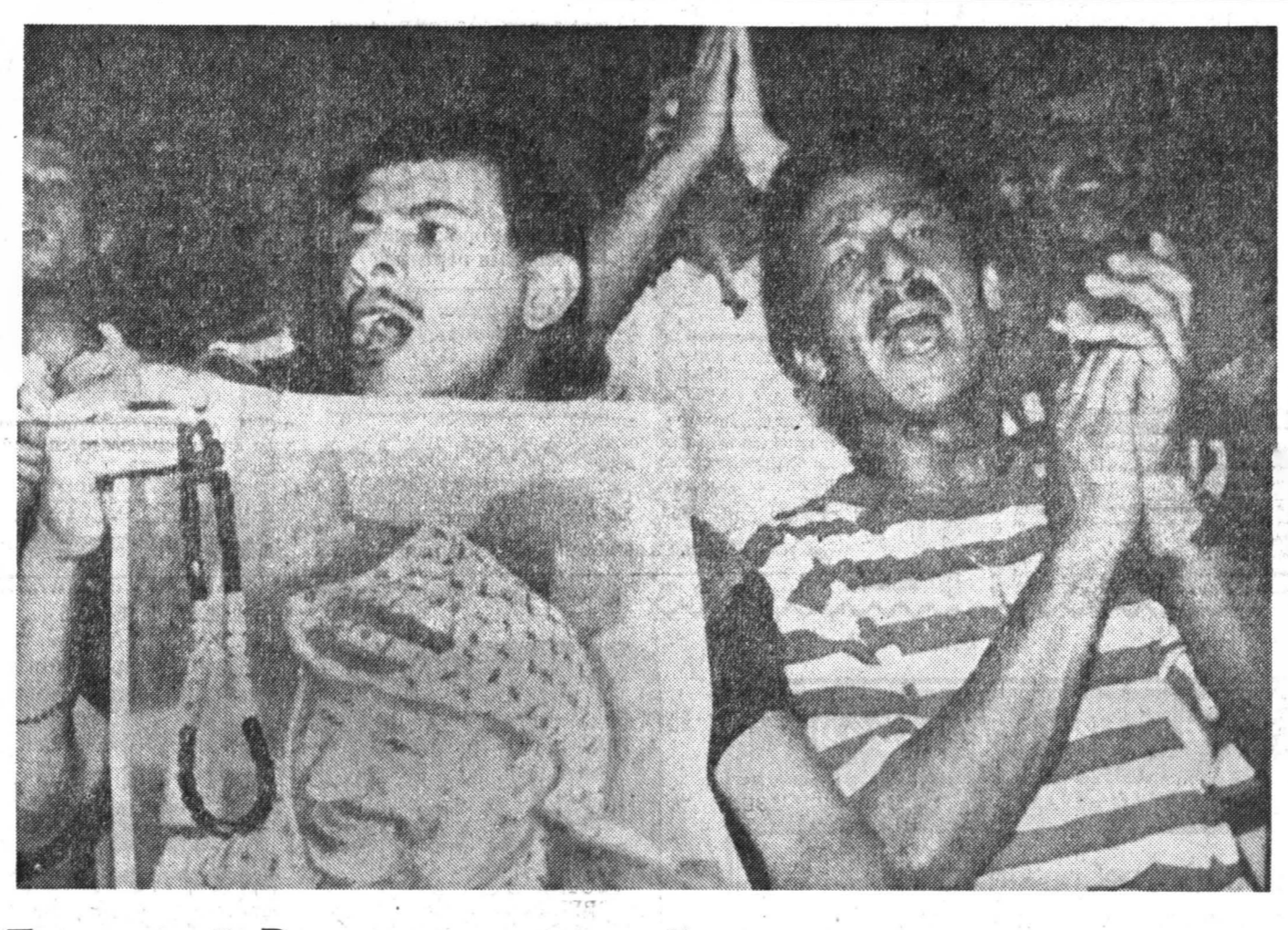
Ближний Восток: здравый смысл получает шанс. На переговорах между израильтянами и представителями Организации освобождения Палестины...

мируются русские группы. Но профессор лукавит. Русские группы на некоторых факультетах сохраняются исключительно для подготовки учителей основной школы (1—9-е классы) с русским языком обучения.