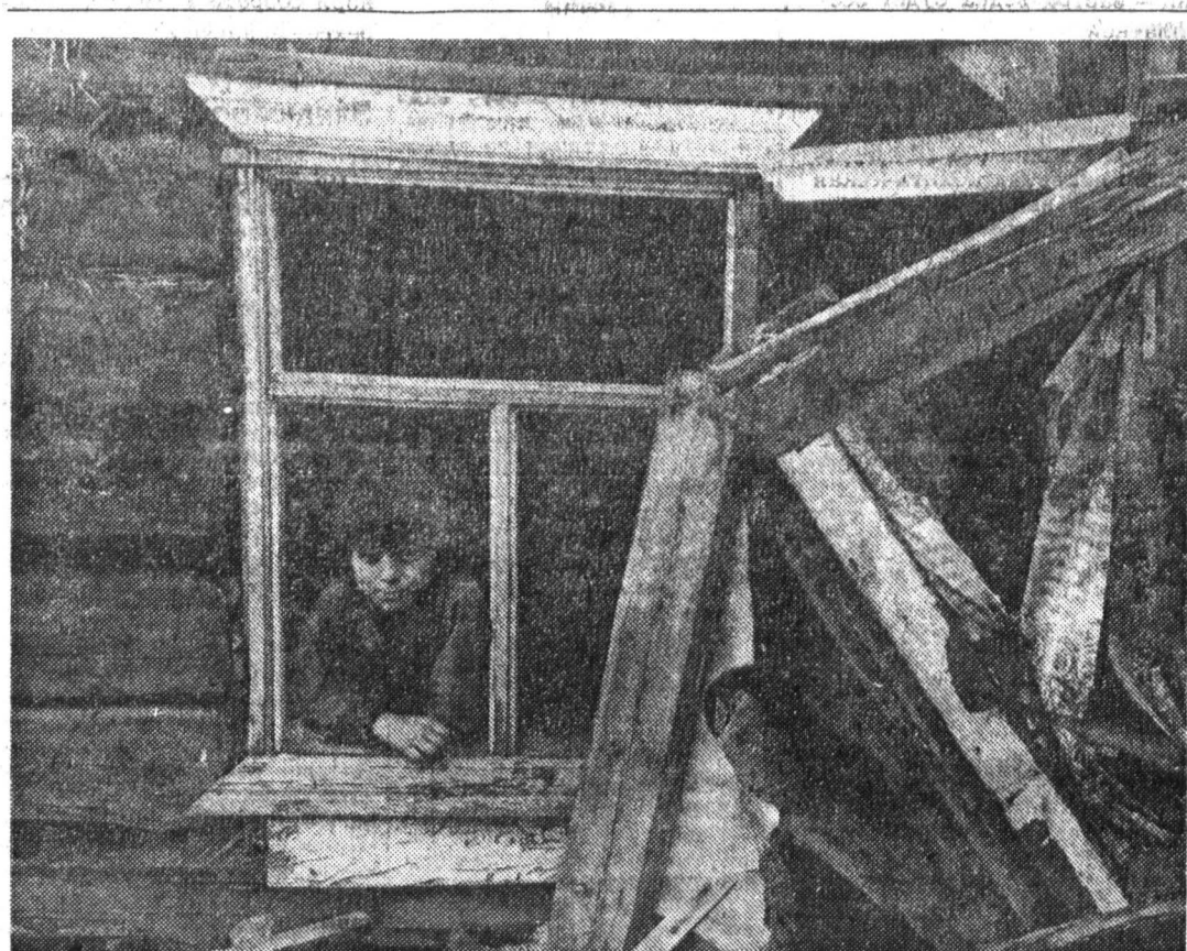
ЯКУТИЯ. Поселок Кулар, где живут золотодобытчики.

Удерживание высокой инфляции на фоне стабильного курса рубля к доллару становится недопустимым, слышим высокие общественные потери. Кому выгодно эта ситуация? В основном отечественному торговому капиталу, ориентированному на импортные поставки. Ситуацию более благоприятную даже придумать сложно. Торговый капитал и так имеет стабильный доллар для закупок и постоянно растущие цены в