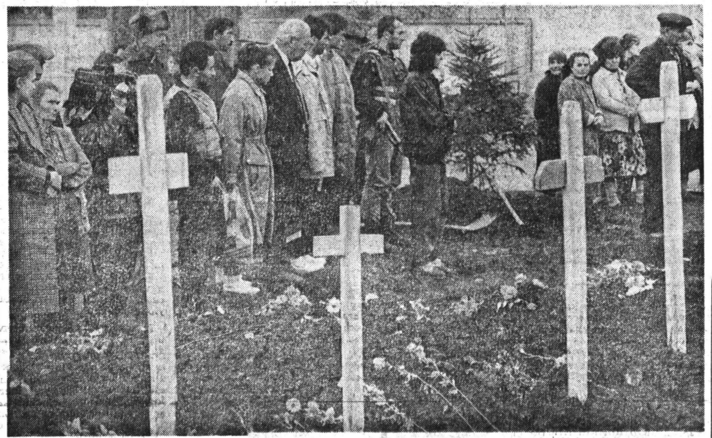
г. Владикавказ. Похороны жертв осетино-ингушского конфликта.