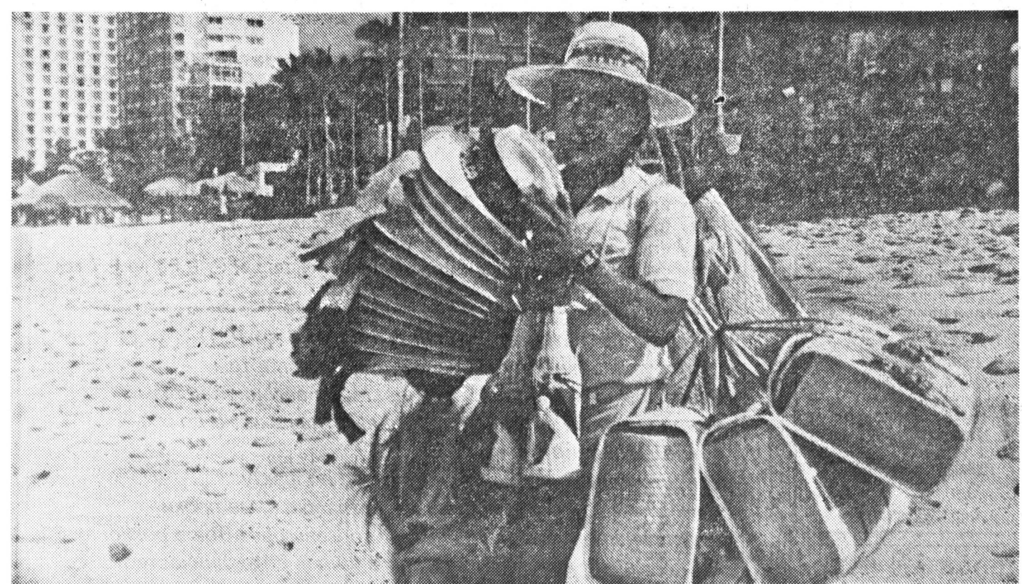
Мексика: пляжи — частникам

три года назад для того, чтобы отстаивать интересы Квебека на общенациональном уровне.