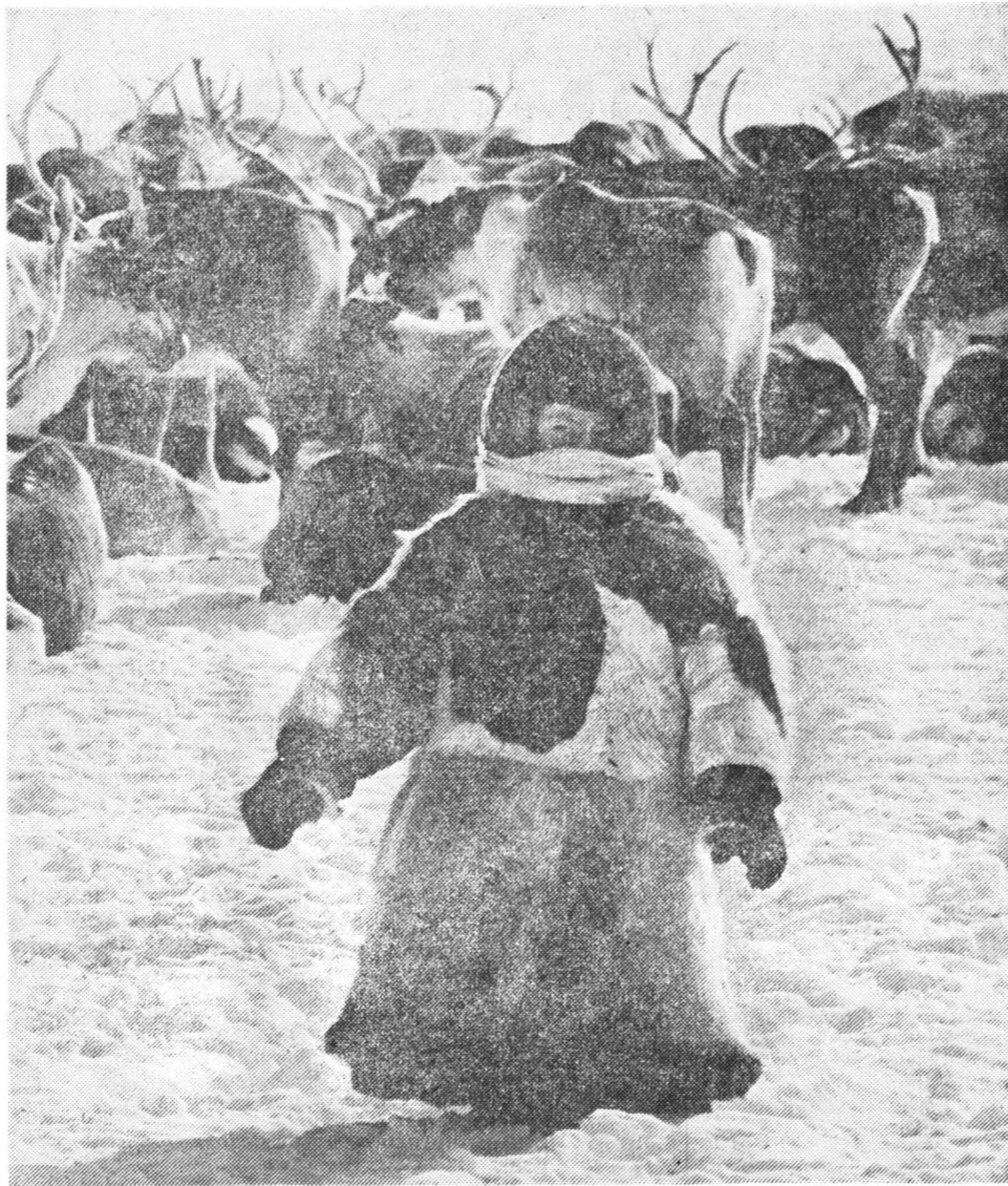
● Не страшны мне ни пурга, ни метели...