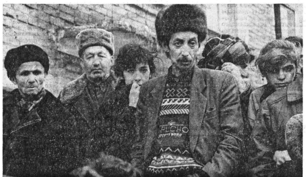
Беженцы из Ингушетии.

Москва ответа не дала: КНК для центра остается по существу открытой, ее экстремистским крылом, сильно осложнившей русско-грузинские отношения участием своих добровольцев на стороне Абхазии. «Желаете ли вы выйти из состава России?» Две трети респондентов ответили «нет», так же ответили 50 процентов опрошенных беженцев из Пригородного района и Владикавказа, и 43 процентов ответили «да». Назранский ЦИПН считает: единственный выход из тупика — введение федерального управления в зоне конфликта, основной задачей которого станет обеспечение прав человека. К необходимости временного особого управле-