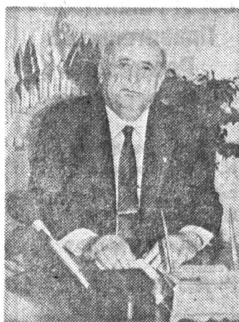
Президент Турции Сулейман ДЕМИРЕЛЬ