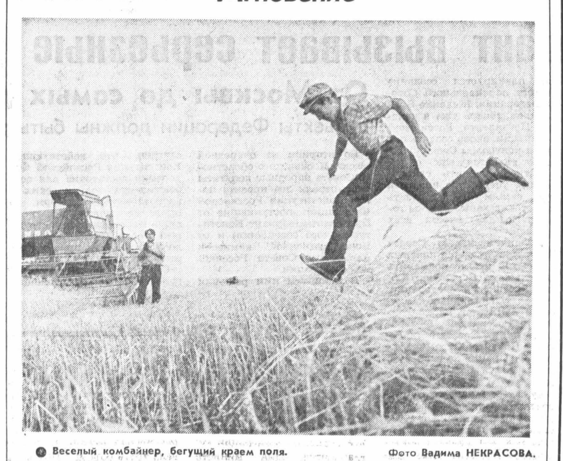
Веселый комбайнер, бегущий краем поля.