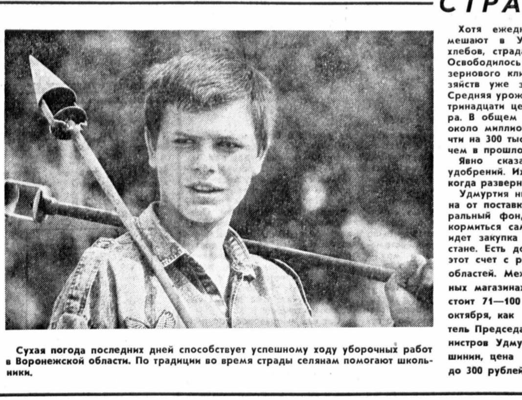
Сухая погода последних дней способствует успешному ходу уборочных работ в Воронежской области. По традиции во время страды сельчанам помогают школьники.

ПРЕСС-КОНФЕРЕНЦИЯ Самые равные среди всех остальных