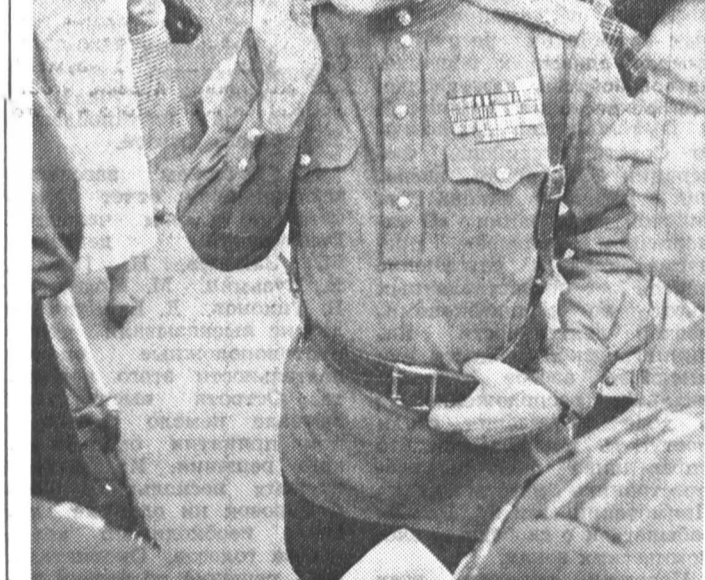
«Слава тебе, Господи, что мы — казаки!». Под таким девизом Союз казаков (СК) и издательство «Роман-газета» на высокой патриотической ноте