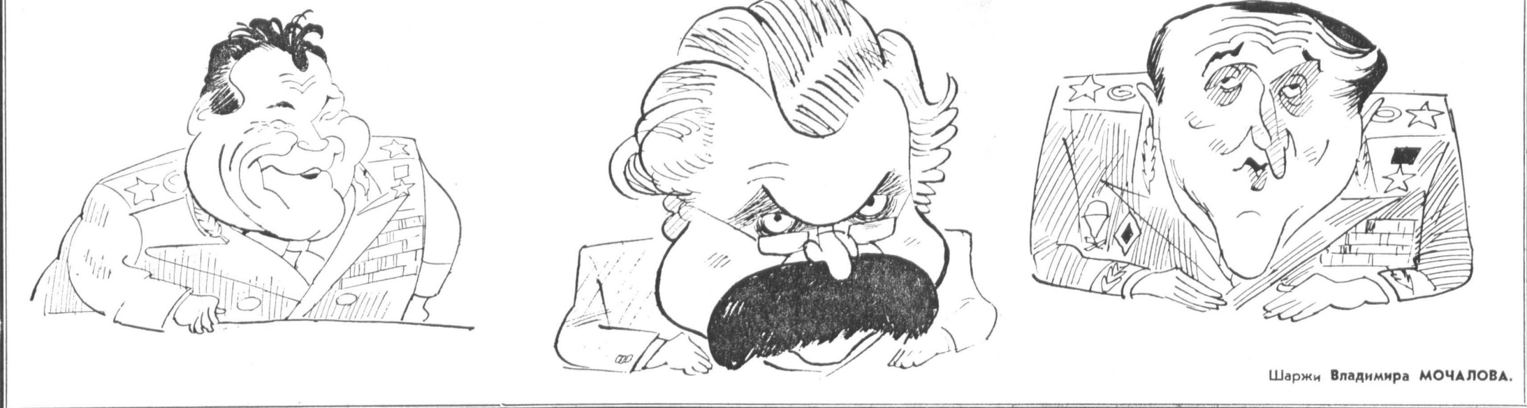
Шаржи Владимира МОЧАЛОВА.