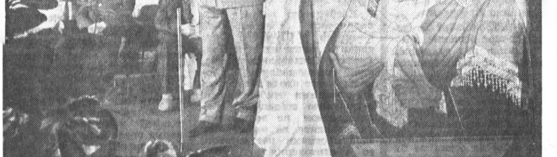
ей организации — Союзу казаков, который ныне объединяет 15 казачьих войск и около 80 землячеств. Примечательно, что на этом памятном вечере присутствовали участники малого совета атаманов, начавшего, по счастливому совпадению, свою работу именно в эти юбилейные дни, чтобы обсудить, в частности, комплексную государственную программу познания экономического и культурного становления казачества.