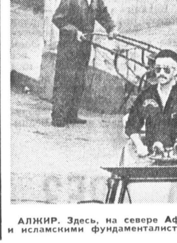
Алжир. Здесь, на севере Африки вновь усиливается конфронтация между силами безопасности и исламскими фундаменталистами...