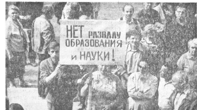
НИИ МГУ НА ЛЕНИНСКИХ ГОРАХ, ИМЕЛ К ЭТОМУ ПРЯМОЕ ОТНОШЕНИЕ.

О БЕДНОМ СТУДЕНТЕ ЗАМОЛВИТЕ СЛОВО ФИНАНСИРОВАНИЕ ВУЗОВ ОСТАЕТСЯ ОДНОЙ ИЗ ОСТРЕЙШИХ ПРОБЛЕМ ВЫСШЕЙ ШКОЛЫ, И МИТИНГ, КОТОРЫЙ БЫЛ ПРОВЕДЕН ВЧЕРА У ЗДА-