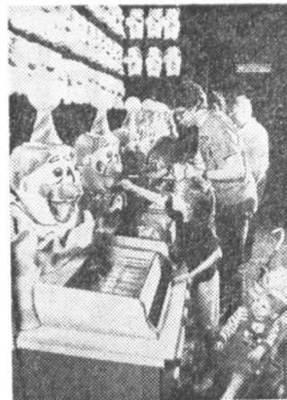
50 больших (на жаргоне — тысяч), так что вы думаете? Пока не спустит их до цента, от стола не отойдет. Слово приклеивается к нему. Мы его не держим, не уговариваем, но велел он себя как по какой-то одной схеме. Тот кому повезет загорается жаждностью и начинает делать сумасшедшие ставки чтобы одним ударом сорвать банк. Глядя на него, другие начинают терять рассудок и бросаются подражать. А кончается обычно для всех лырой в кармане да долгами нашим кредиторам.

и стали выглядеть как знаменитый детский парк «Лиснейленд». Средневековые замки, развальные мосты, синтетические джунгли, огромные аквариумы. В отеле «Мираж» есть даже механический вулкан, который каждый полчаса извергает слалко пахнувший дым. Сместалистные бизнесмены быстро обуровудили в городе популярные «трейлер паркс» — эдакие «лагеря» для автотуристов, куда можно привезти всю семью, в том числе и младенцев. Для малышей предумотрительно сооружены «лагушатники». В результате отдыхающие проводят в Лас-Вегасе больше времени, чем раньше, и соответственно оставляют там больше денег.