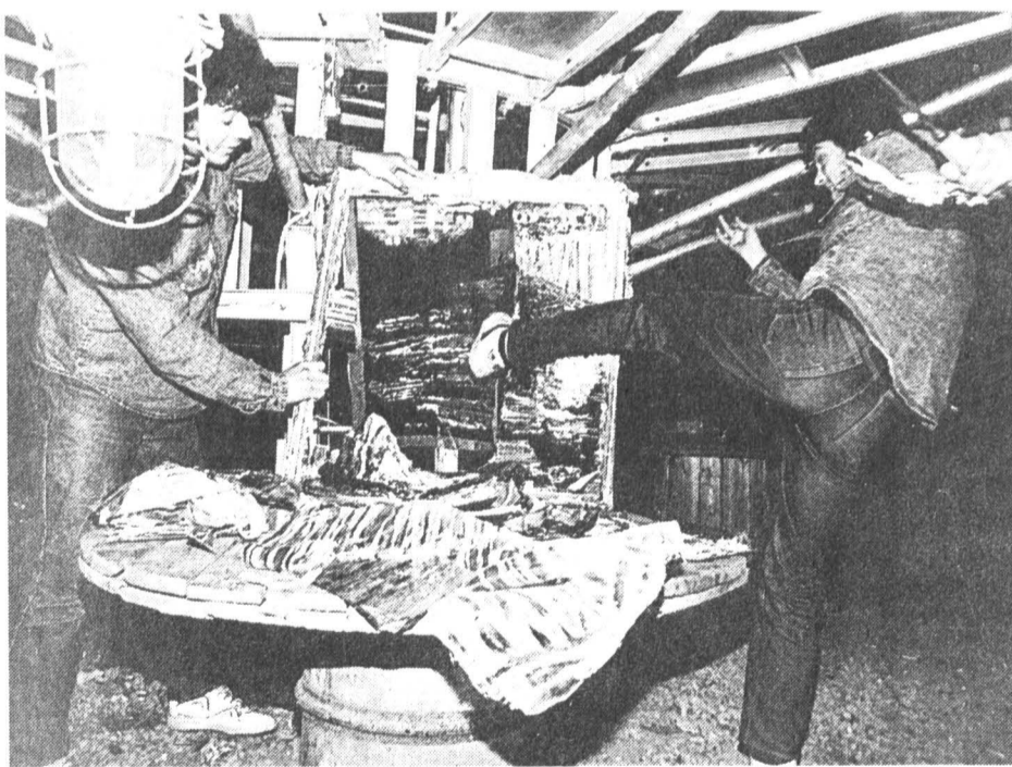
Новые гоголи уничтожают собственные произведения