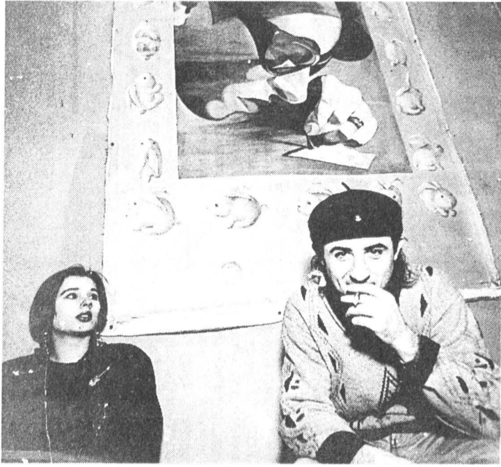
Музыканты группы «Шейк» («Третий путь»)