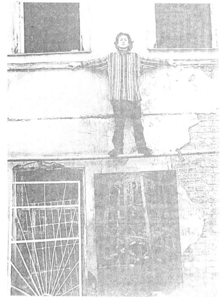
Художник Аристарх Чернышев и его работы