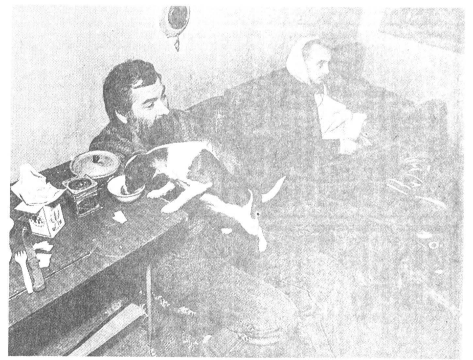
Кухня «Третьего пути»