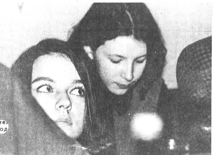
Они пойдут «Третьим путем»