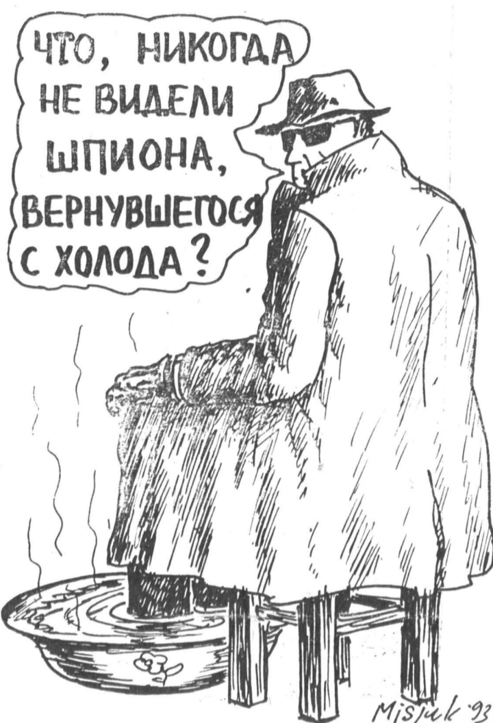
Рисунок Вадима Мисюка.

Авторы доклада считают необходимым заострить на этом внимание, так как в 1995 году истекать срок действия Договора о нераспространении ядерного оружия — главного международного инструмента, фиксирующего сегодня обязательства государств в ядерной области. В этой связи встанет вопрос о его бессрочном продлении.