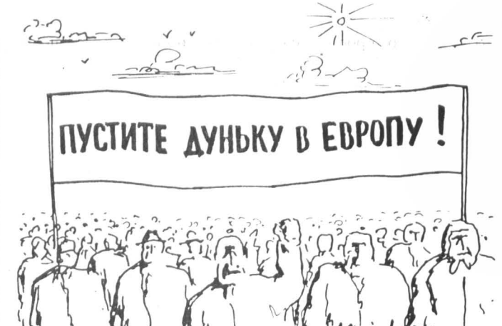
Рис. В. Мисюка

В этом случае в различных аккредитованных при МИДе организациях и кооперативах, малых предприятиях и акционерных обществах подобная заявка обходится в сумму от одной до пяти тысяч рублей — как повезет. Боже, думал я, как же МИД протестует с тем плавным потоком визток, получаемых за эти выездные визы? А ОВИР — УВНР так парой и окажется на улице без работы? Ничуть не бывало. Во-первых, все при деле. Во-вторых, на январь гарантирован ажиотажный спрос: никто же об уточнениях КАК ИМЕННО освобождается выезд, извещен не был. И кукуют на Неполномочном людях с билетами на 13-е и американской визой, но без «согласования», без объективной, без «согласования» и без 14 дней, столь необходимых консульскому отделу для предоставления печати. Я так и вижу человека, который две недели ставит печать — медленно-медленно, двое суток, он достает паспорт, еще три дня листает его в поисках свободного личисточка, субботу-воскресенье отдыхает от непосильности трудов, а потом четверть суток заносит над обчерченной бумагой печать и еще два дня прижимает ее для лучшего качества отпечатка. Что же может сбить это навязчивое рапсод с консульского работника? Не берусь сказать, но могу поделиться информацией о ценах, что барражируют вокруг консульского отдела. Без спешки и без документов выездная виза предоставляется многообразными туристскими фирмами — за 7 — 10 тысяч руб. Но если у вас нет двух недель, то