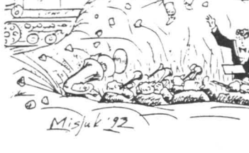
Рисунок В. Мисюка

И пошло-поехало. Запело-заголосило... Сергей не столько чинил электротрумакшину, технику, сколько — усовершенствовал. Уже через зычный период (с хостиком) извещала Соноя, что обеспечил постоянно прописку и строит кооператив. Да