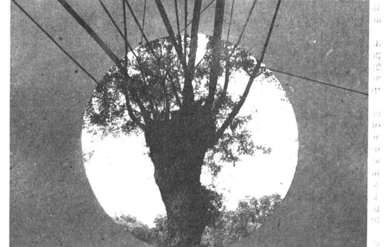
Из серии «Продолжения» — 1992 г.

своей концепции артефакта» художник формулирует это основополагающий принцип так: «Современный мир техник. Техника представляется мне новым пространством, возникшем на пути эволюции человечества, которое ему предстоит пройти». Инфантэ не свои эксперименты самостоятельны, но как показало время, его искусство включается в контекст синхронных и аналогичных поисков ряда известных зарубежных художников (Г. Юнкер, Кристо, Р. Лонг, Р. Смитсон). Мышление Инфантэ парадоксально и современно, ибо направлено на художественное выражение — через столкновения и контрасты — принципиально важных и объемных понятий, измышленных и стертых от частого употребления в современном искусстве.