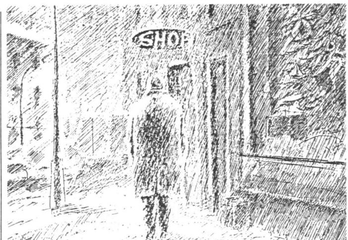
Рисунок В. Мисюка