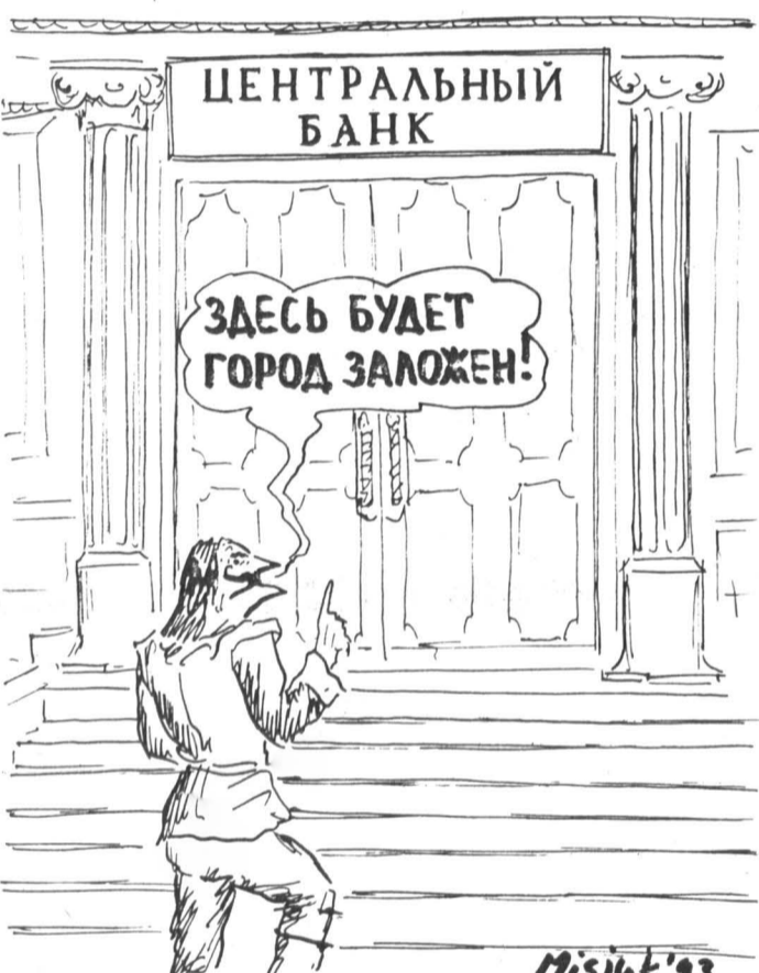
Рисунок Ваима Мисюка