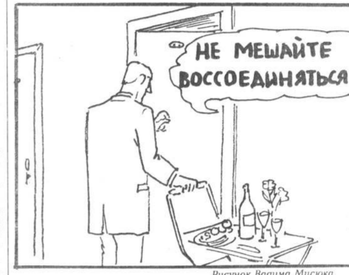
Рисунок Вагима Мисюка.

Исчезновение СССР и поддержка Россией одной из противоборствующих сторон на Корейском полуострове являются, на мой взгляд, главными причинами очередного обострения корейского кризиса как следствия мирового кризиса социализма. Противостояние двух систем — капитализма и социализма — как бы сосредоточилось в одной маленькой Кореи. Одна из ее частей — северная — оказалась в роли социализма и брошенной социализмом. Теперь уже ей ничего не остается, кроме как обратиться за помощью к Китаю. Руководством КНДР такой шаг сделан.