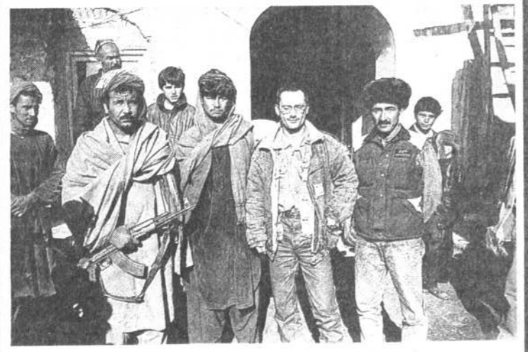
Корреспондент «НГ» среди афганских моджахедов (слева) и таджикских беженцев (справа).

Некоторые опасения вызывает и тот факт, что, как утверждают гармские таджики, с родины их выгнали узбеки, в северном же Афганистане, где обосновались беженцы, велика доля соплеменников их недавних преследователей.