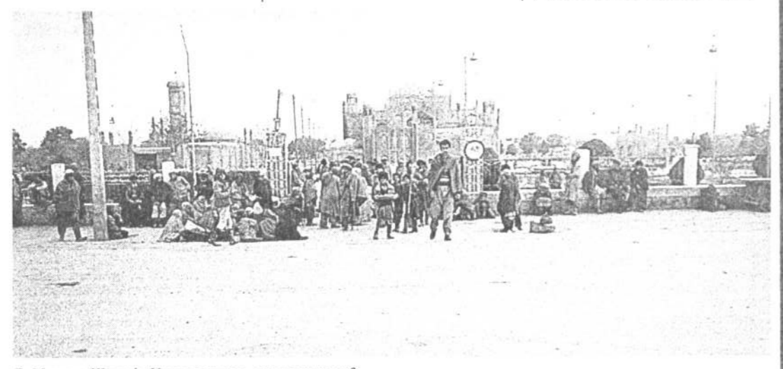
Г. Мазари-Шариф. Новая родина для таджиков

Возникает парадоксальная ситуация: большинство беженцев искренне не хотят воевать и мечтают вернуться домой с миром, однако обстоятельства провоцируют их взять в руки оружие. Тоска по родине, тяжелые условия жизни, нестабильная политическая ситуация в Афганистане порождают отчаяние, и все чаще можно услышать такую фразу: «Я возьму автомат и пойду умирать в мой Таджикистан».