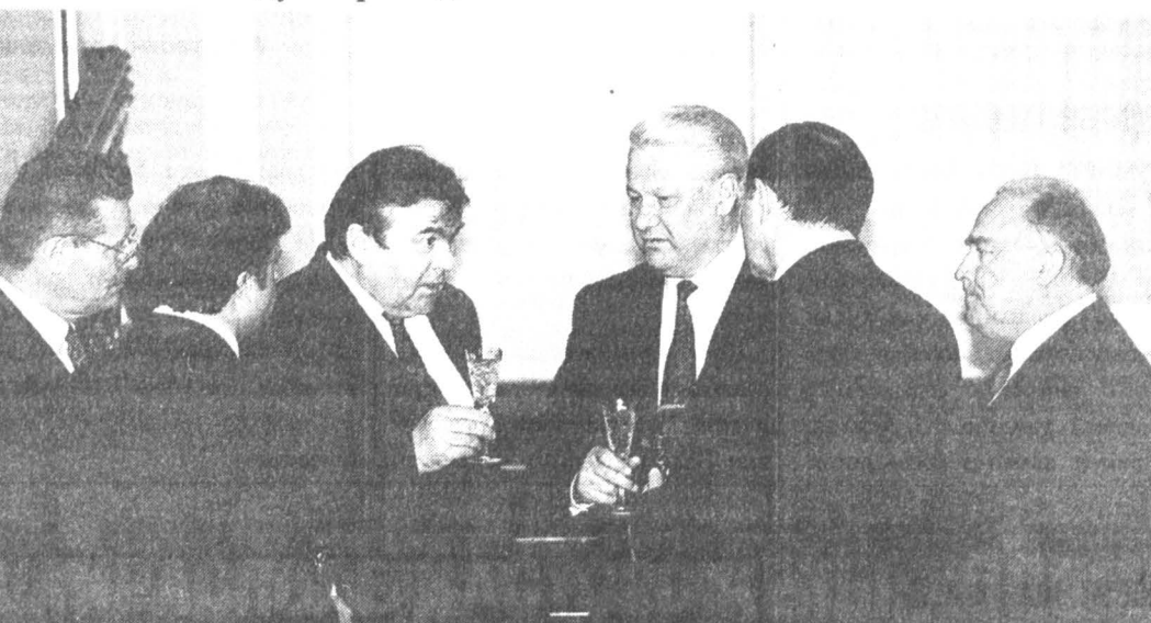
Президент Ельцин и Сighet после завершившихся переговоров в Кремле.