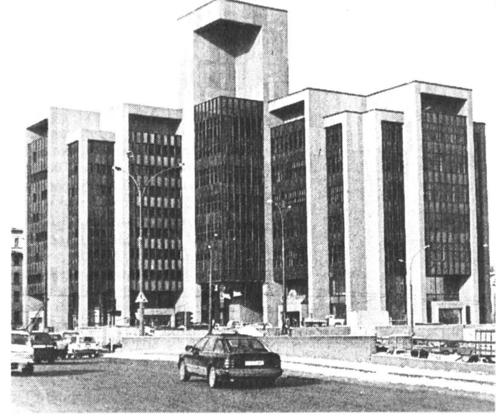
Здание на Сретенском бульваре, 11, вокруг которого кипит страсти

СРЕДИ унылого московского архитектурного пейзажа любое здание, имеющее нестандартные формы, мгновенно привлекает к себе внимание. На Тургеневский бульвар, 11 — это прежде всего дом, сложенный из бурого камня. Его сооружение началось еще КПСС, однако завершить строительство престижного здания партии так и не удалось. Незавершенка была передана на баланс Московского электромашинного завода (МЭАЗ). А в 1991 году на базе недостроенного комплекса было создано СП. С английской стороны его соучредителем выступила фирма «Margo International LTD», владельцем которой является доктор Осман — бизнесмен арабского происхождения.