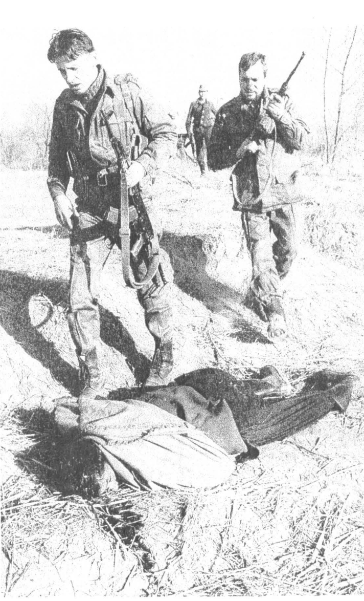
Таджико-афганская граница. Чистка приграничной полосы. Вооруженных нарушителей-афганцев отряд спецназа Комитета нацбезопасности в плен не берет.