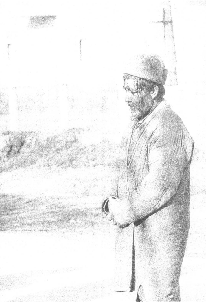
В кишлаке под Кумсангиром. Этот крестьянин, обвиненный в поддержке оппозиции, был расстрелян через несколько минут.