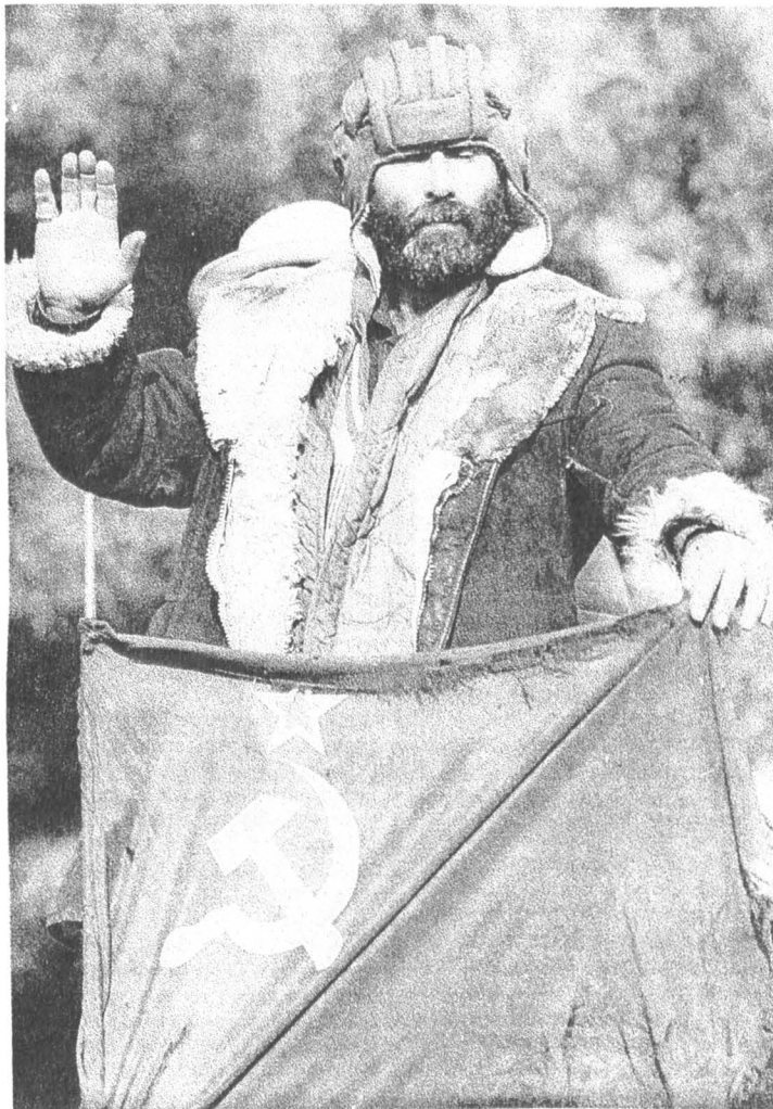
Национальный гвардеец Республики Таджикистан.