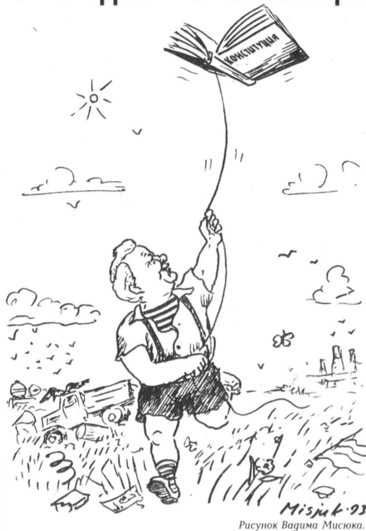
Рисунок Вагима Мисюка.