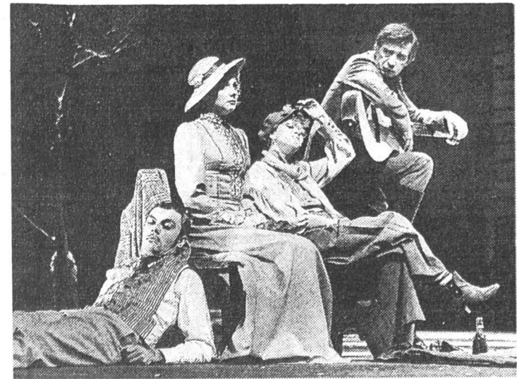
«Вишневый сад». Начало II акта.