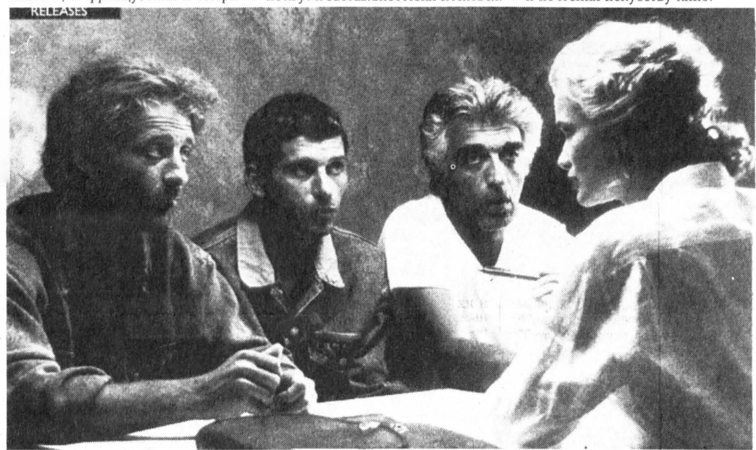
Кадр из фильма «Все это... для этого!» Клода Лелуша.

Мы познакомились в 1968-м на съемках картины «Жизнь, любовь, смерть» во дворце бывшей тюрьмы Нантера. После триумфа, дожда награды не прошло и двух лет, а уже на экране шли еще три ленты: «Жить, чтобы умереть» и документальные — «13 дней во Франции», снятая вместе с Франсуа Рейшенбахом во время Оливиера, и «Далеко от Вьетнама» — коллективная кинокадра французских и амери-