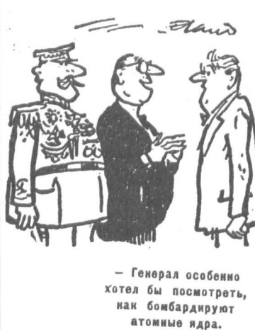
Карикатура из книги «Физики продолжают шутить».

Существенную часть времени в лабораториях и кабинетах ученые посвящают приготовлению и потреблению кофе (в Великобритании предпочитают чай). Количество поглащаемого напитка и вре-