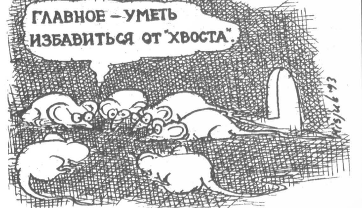
Рисунок В. Мисюка.

переложить ответственность на других и оправдать собственную инертность. Так что же взять за ориентиры? Разум, гражданственность и организованность. Последний ориентир принципиально важен. Время доверия к власти окончилось. Нынешний режим, по существу, дискредитирует основные принципы демократии. Представляется совершенно необходимой организация партии работников интеллектуального труда, призванной синхронизировать усилия для вывода общества на путь поступательной эволюции. Нельзя допустить, чтобы оно, находясь вблизи точки потери устойчивости (доказательством чего является бурно протекающий процесс распада государственности), было переведено в режим прогрессирующей дегенерации. Используя политические свободы, институты парламентаризма и референдума, имея прямой доступ к обществен-