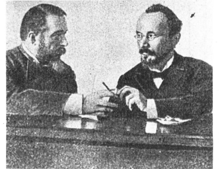
В.В. Розанов и И.Ф. Романов (Рцы), 1901 г.

«Кожа» — сначала выделяется курсивом (т.е. просто ткнул пальцем: смотри!), потом — кавычки (колдует, «отрывает» слово от пер-