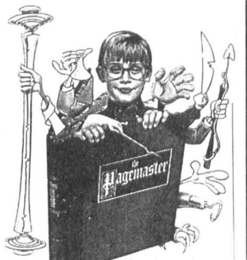
Маклей Калкин в фильме «Повелитель страниц».

ЗВЕЗДА фильмов «Один дома»-1 и 2 Маклей Калкин снимается в новом приключенческом фильме «Повелитель страниц» («Pagemaster»). Его героя постоянно преследуют самые различные неприятности, и вот однажды, во время грозы, он прячется в библиотеке и видит, как со страниц книги сбгаются персонажи мультфильмов. Мальчик убегает в волшебный мир фей и чудовищ, переживает